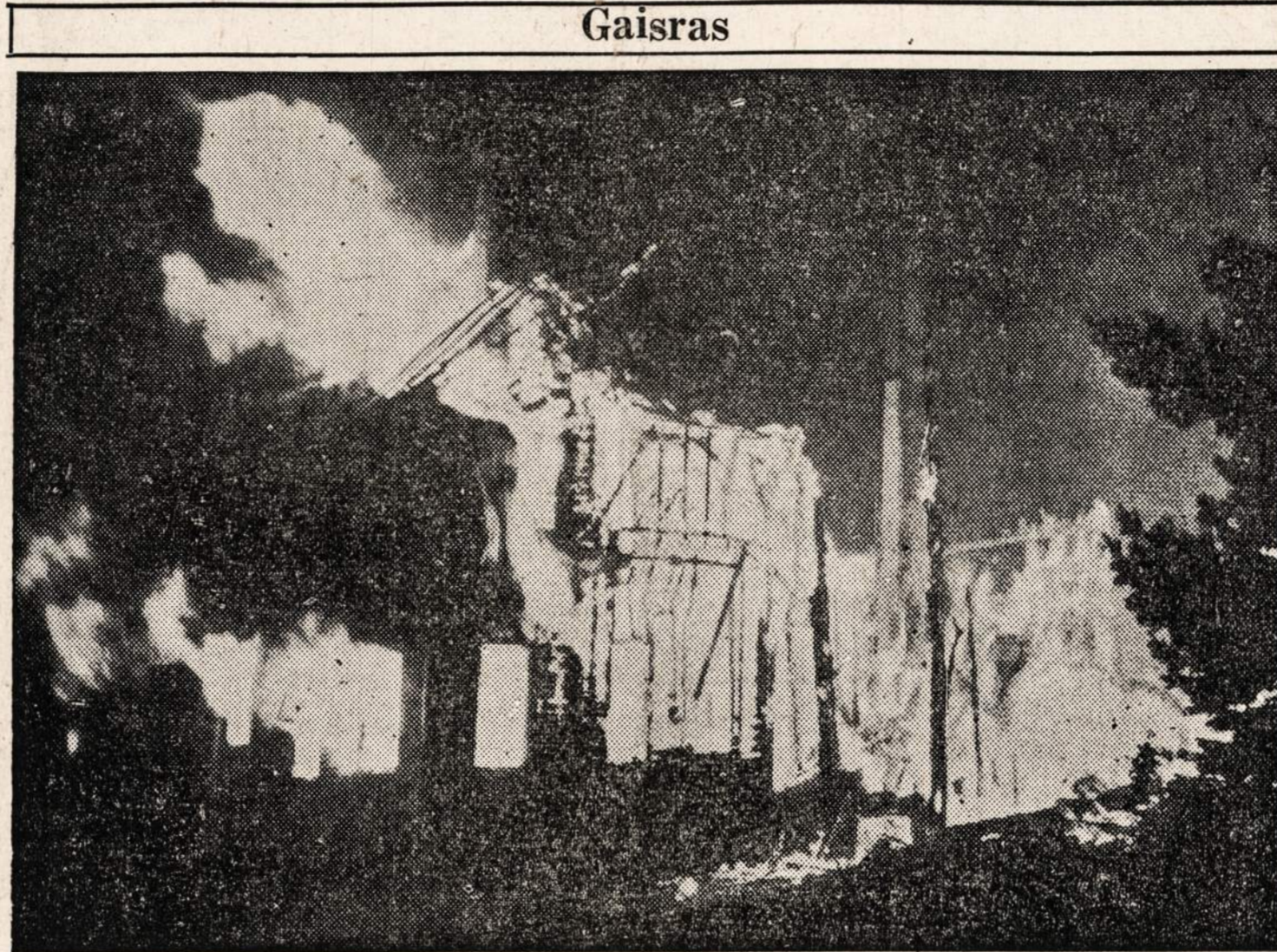
Vasarnamiai netoli Porpoise (Me.) virto pelenais, kai kilo vienas didžiausių miško gaisrų valstijos istorijoje.

Vėsesnis. Saulė teka — 6:14; leidžiasi — 4:56.