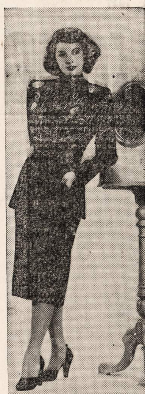
THE GLAMOROUS WARD-ROBE worn by Ava Gardner in M-G-M's "The Hucksters," in-cludes this "come-hither" black wool suit created by Irene. The exciting Ava is scheduled next for the leading feminine role opposite Van Johnson in the studio's forthcoming film, "Wanted."