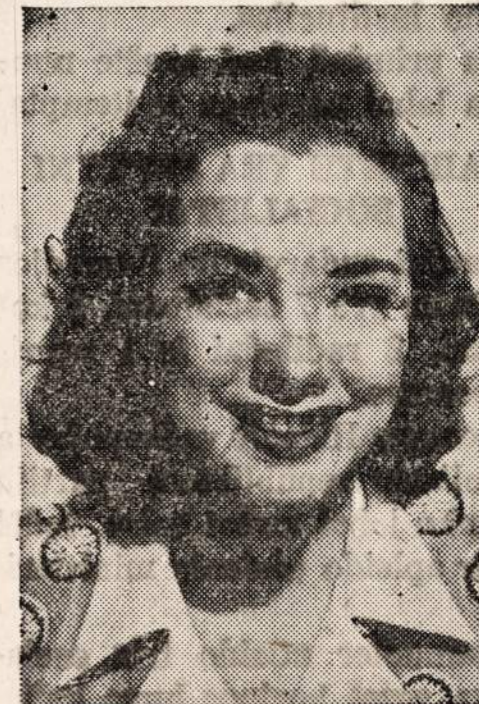
Kathryn Grayson M-G-M Star