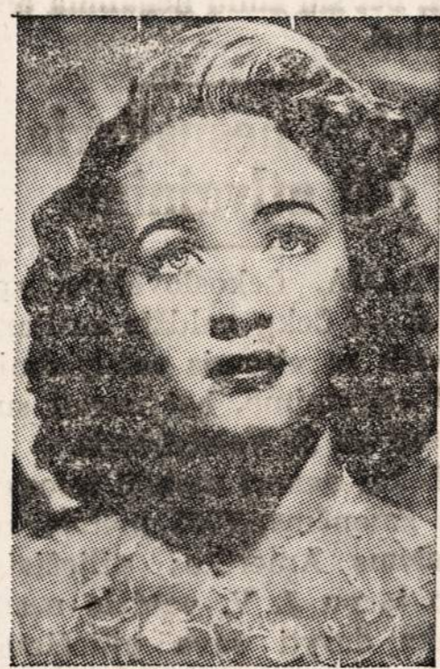
Jane Powell M-G-M

SKAITYKITE IR KITUS RAGINKITE SKAITYTI "NAUJENAS"