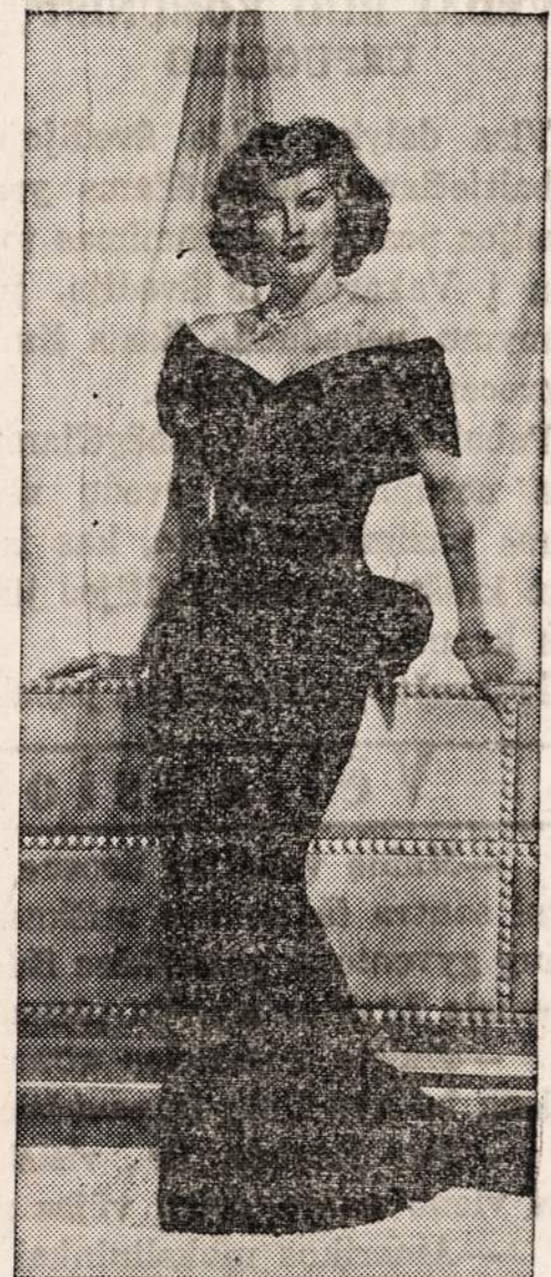
AVA GARDNER, who follows up her leading role in "The Killers" with a superb performance in "The Hucksters," M-G-M's pic-turization of the Frederic Wake-man best seller, has been cast opposite Van Johnson in "Wanted," Ava's acting in both roles makes her a sure bet for the next stardom.