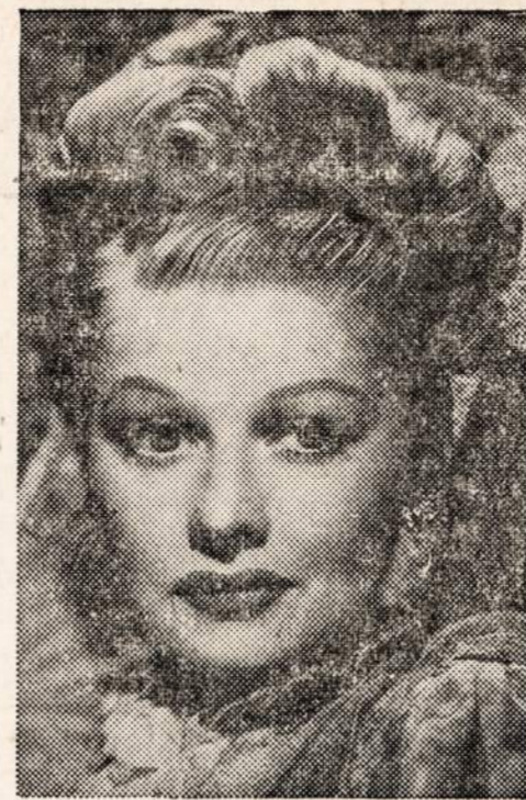
Lucille Ball M-G-M Star