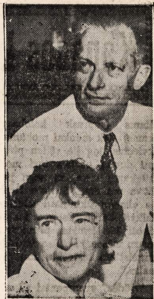
ST. LOUIS, Mo. — Daktarai Gerly T. ir Carl F. Cori, Washingtono universiteto medicinos fakulteto profesoriai, kurie laimėjo Nobelio dovaną. Jie yra kilę iš Čekoslovakijos ir baigę Pragos universitetą.

Tuo pačiu čia gyvenančių tremtinių padėtis labai pasun- kės. Mat, jų dalis jau yra įsi- traukusi į vokiečių bendrą ūkį ir jų maistu minta. Kiti, kad ir iš šalies gauna maisto produk-