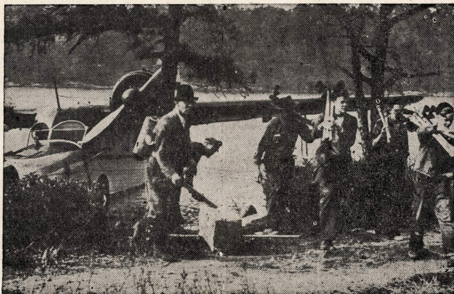
New Yorko valstijos konservacijos departamento gaisrininkai lėktuvu atvyko į Ulster kauntę gesinti miško gaisrą.