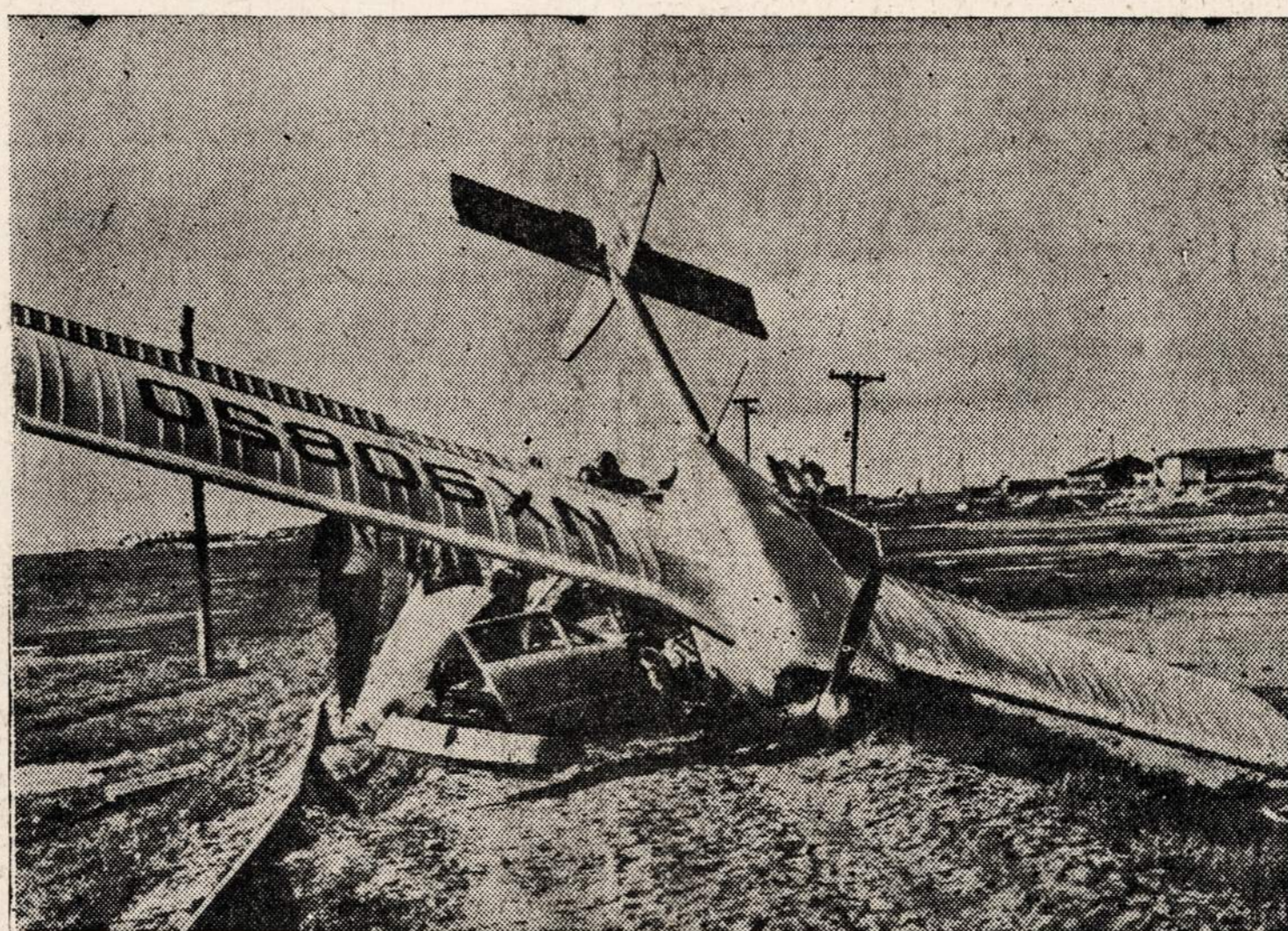
CHULA VISTA, Calif. — Auto-lėktuvas besiskrisdamas per žemai nukrito ir susidaukė. Juo skridę asmenys buvo sužeisti, ypačiai skaudžiai nukentėjo vairuotojas.