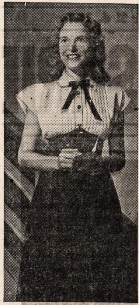
JUST NINETEEN. Janet Leigh, a college co-ed herself, is the ideal model for football fashions. For the football prom, Janet chooses a white silk pleated shirtwaist and long black faille skirt. Miss Leigh, who won overnight popularity in M-G-M's "The Romance of Rosy Ridge," will soon be seen in "If Winter Comes" opposite Walter Pidgeon.