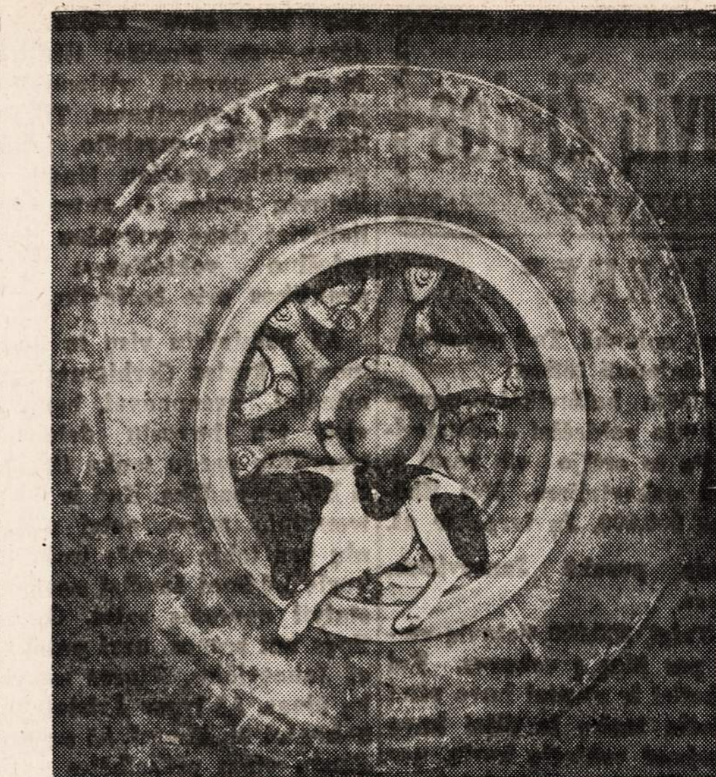
CINCINNATI, O. — Pasinaudodamas trokų draiverių streiku, ilsisi rate.

—J. V. ambasadorius Lewis Douglas vėl sugrįžo į Londoną.