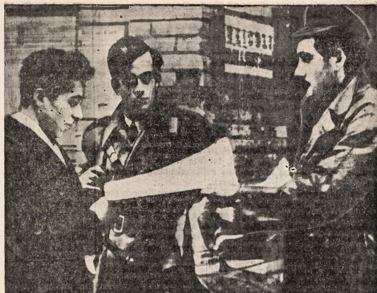
Milane (Italijoje) policininkai saugoja kioskus, kur laikraščiai pardavinėjami, kadangi komunistai ėmė plėšyti jiems nepatinkamus laikraščius.

Ačiū Dievui, vėl galėsime valgyti vištieną, ypačiai Dėkos dieną. Kai vištų "raišinas" pasibaigė, tai ir vištos atpigė. Dabar visi laukia kada mėsa atpigs. Mat, kai žmonės taupo, tai biznieriui daugiau biznio daro. Pav., restoranai dabar mažiau duonos ant lėkštės padeda, o kostumeris moka tiek pat, kiek ir pirmiau mokėjo. Vadinas, biznieriui vietoj 100 kepalų duonos per dieną, išleisda žia tikiai 50 kepalų, o užmokėti gauna už visą šimtą. Neblogas uždarbis!