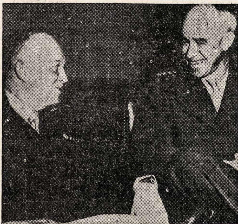
Generolas Dwight D. Eisenhower (po dešinei), kuris rezignavo iš J. V. armijos štabo viršininko vietos, praneša spaudos atstovams, kad jo vietą užimsias gen. Omar Bradley (po kairei).