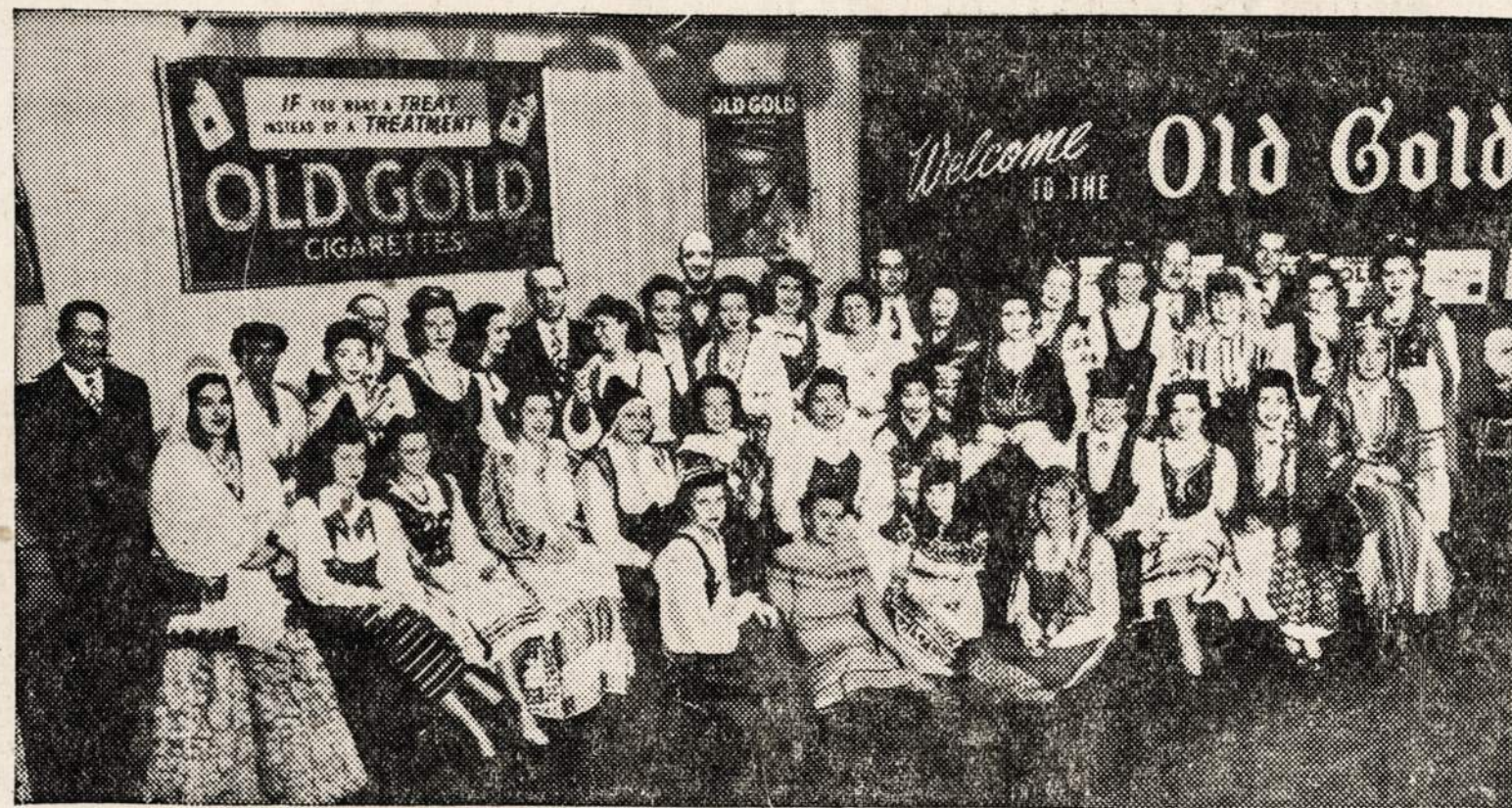
Šioje fotografijoje yra aiškus pavyzdys, kaip žmonės skirtingų išitikinimų, skirtingų tautų, skirtingų religijų, gyvena taikiai ir laimingai Jungtinėje Amerikos Valstybės šiandien. Šis paveikslas yra imtas Women's International Exposition neseniai užsibaigusio New York City. Paveiksle yra 18 skirtingų tautų moterys: Armenijos, Danijos, Estijos, Suomijos, Francūzijos, Vokietijos, Graikijos, Grenada (W.L.), Guatemalos, Italijos, Japonijos, Jugoslavijos, Latvijos, Lietuvos, Meksikos, Norvegijos, Lenkijos ir Švedijos. Imant šį paveikslą, viskas buvo ramioje ir taikioje nuotaikoje.

OLD GOLD CIGARETAI PRISIDEDA PRIE TARP-RASINIO DRAUGINČUMO