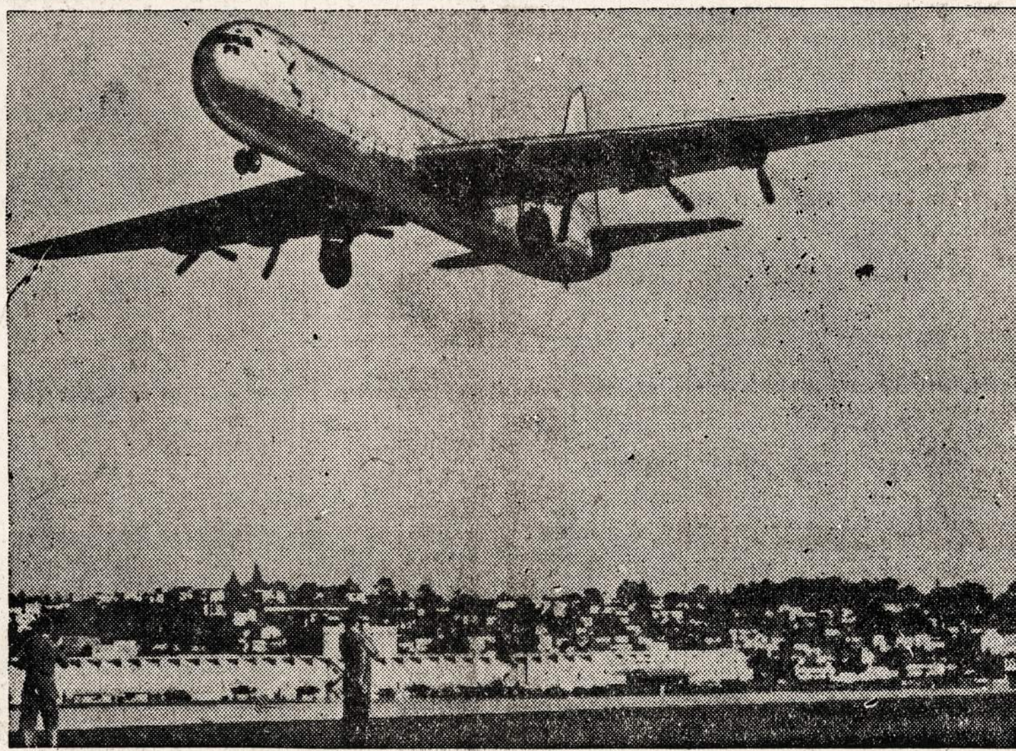
Pasaulio didžiausias lėktuvas gali gabenti 400 karių. Į San Diego (Calif.) aerodromą susirinko 100,000 žmonių pažūrėti, kaip lėktuvas pakils į orą.