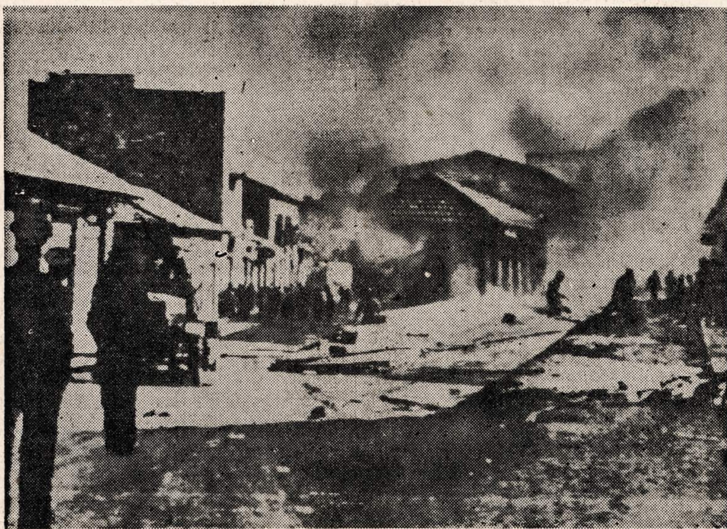
Arabų riaušės Palestinoje. Čia vaizduojama Jeruzalės miesto biznio dalis riaušių metu.