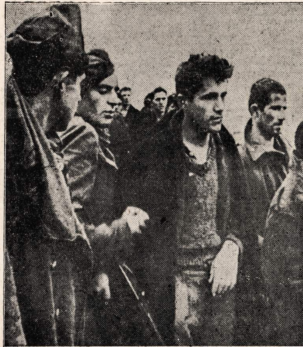
Graikijos valdžios kariai (po kairei) saugo partizanus, kurie buvo suimti šiaurinėje Graikijoje.