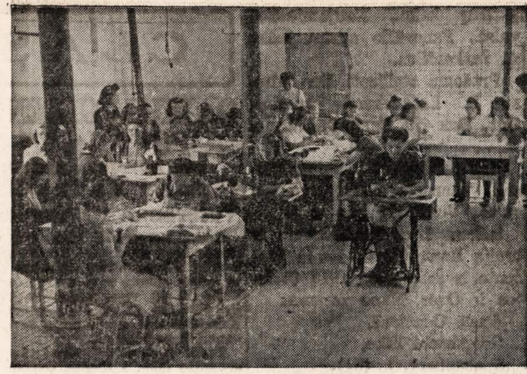
Lietuvės tremtinės mokosi siuti. Vaizdas iš D. P's stovykos, Hanau, Vokietijoje. BALF šelpiti siūskite BALF'ui, 105 Grand Street, Brooklyn 11, New York.