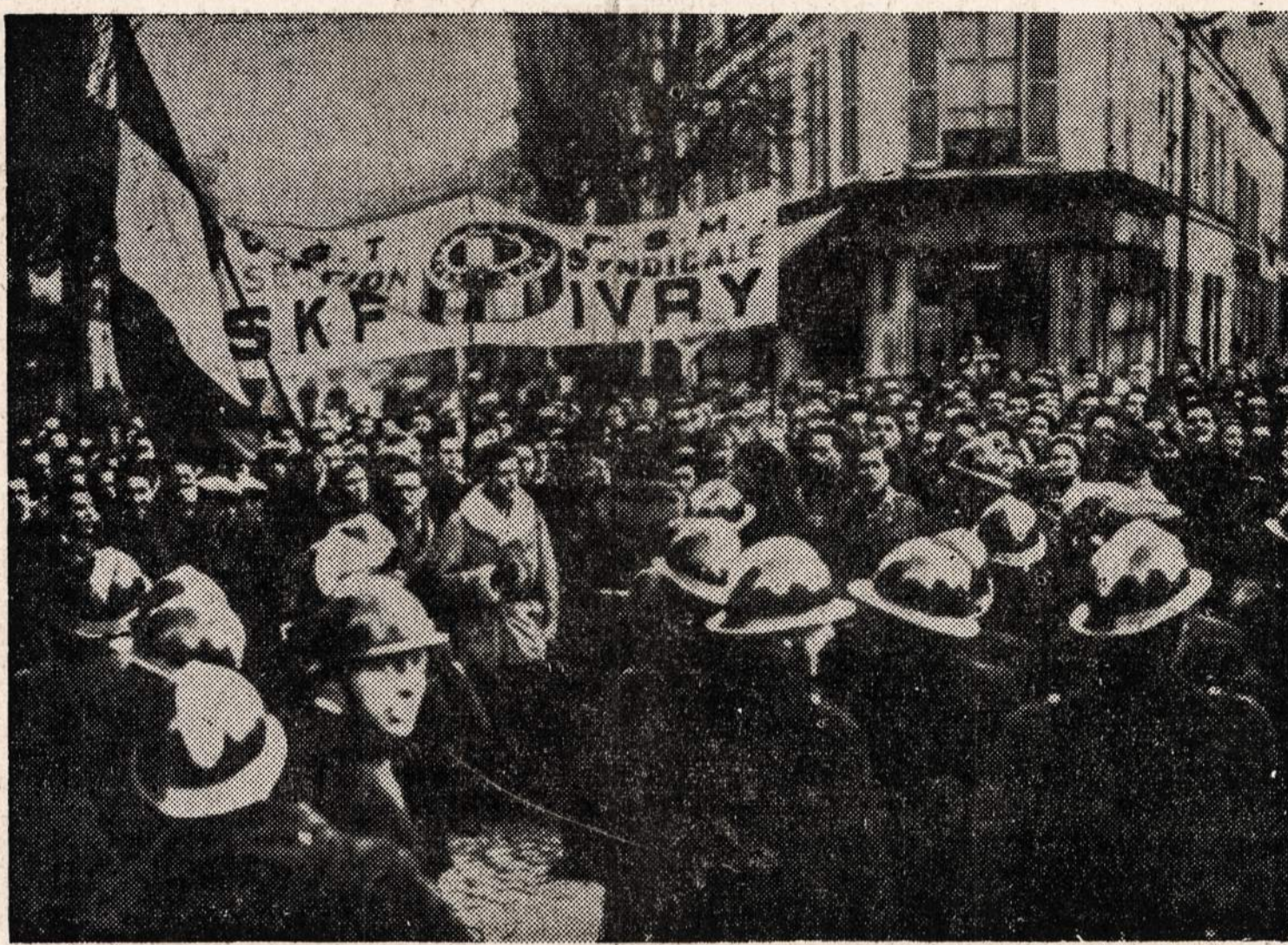
SKF dirbtuvės darbininkai Paryžiaus priemiestyje sulaukė judėjimą, kol atvyko policija ir išvaikė demonstrantus.