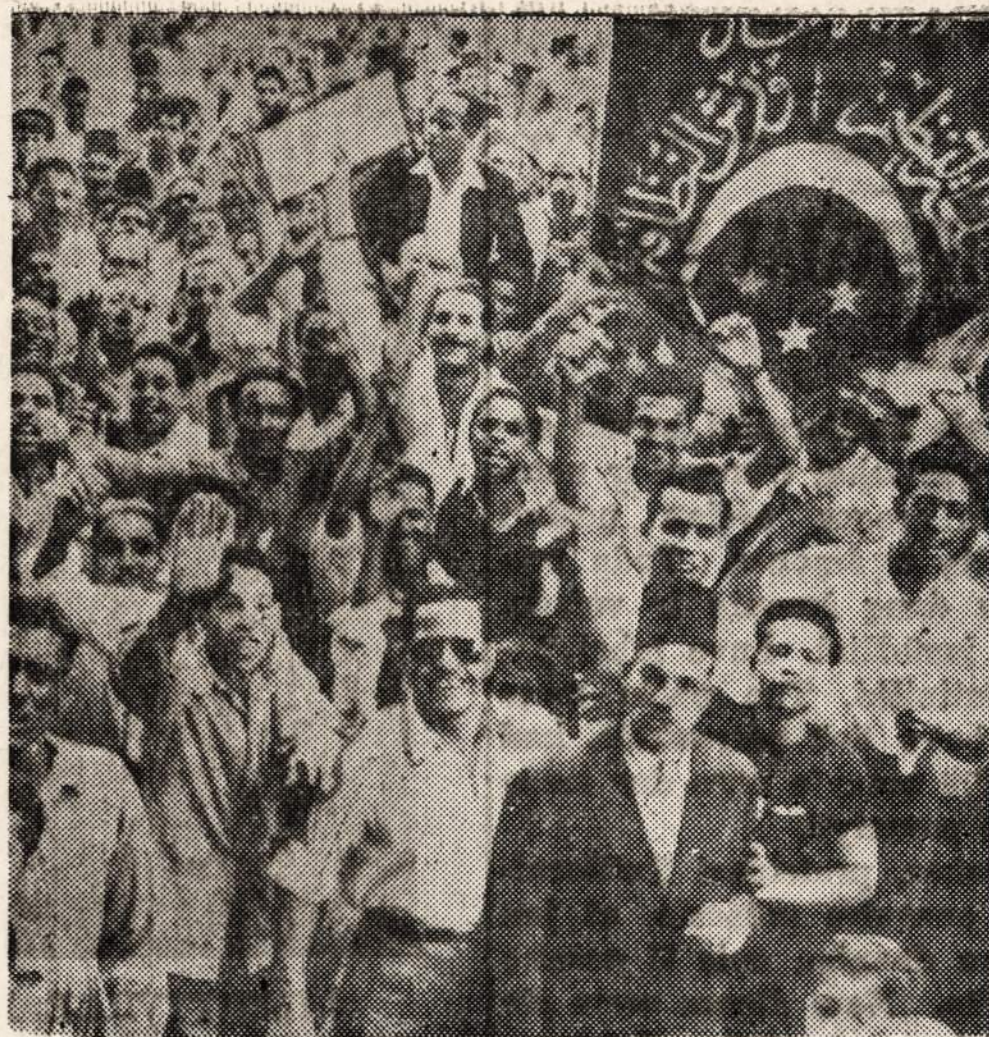
Kaire studentai surengė didelę demonstraciją, protestuodami prieš Palestinos padalinimą. Jie nešė iškabas su užrašais "Šalin Amerika!" "Šalin Rusija!"

"NAUJIENOS YRA JOSŲ GERIAUSIAS DRAUGAS —UZSIRAŠYKITE JAS