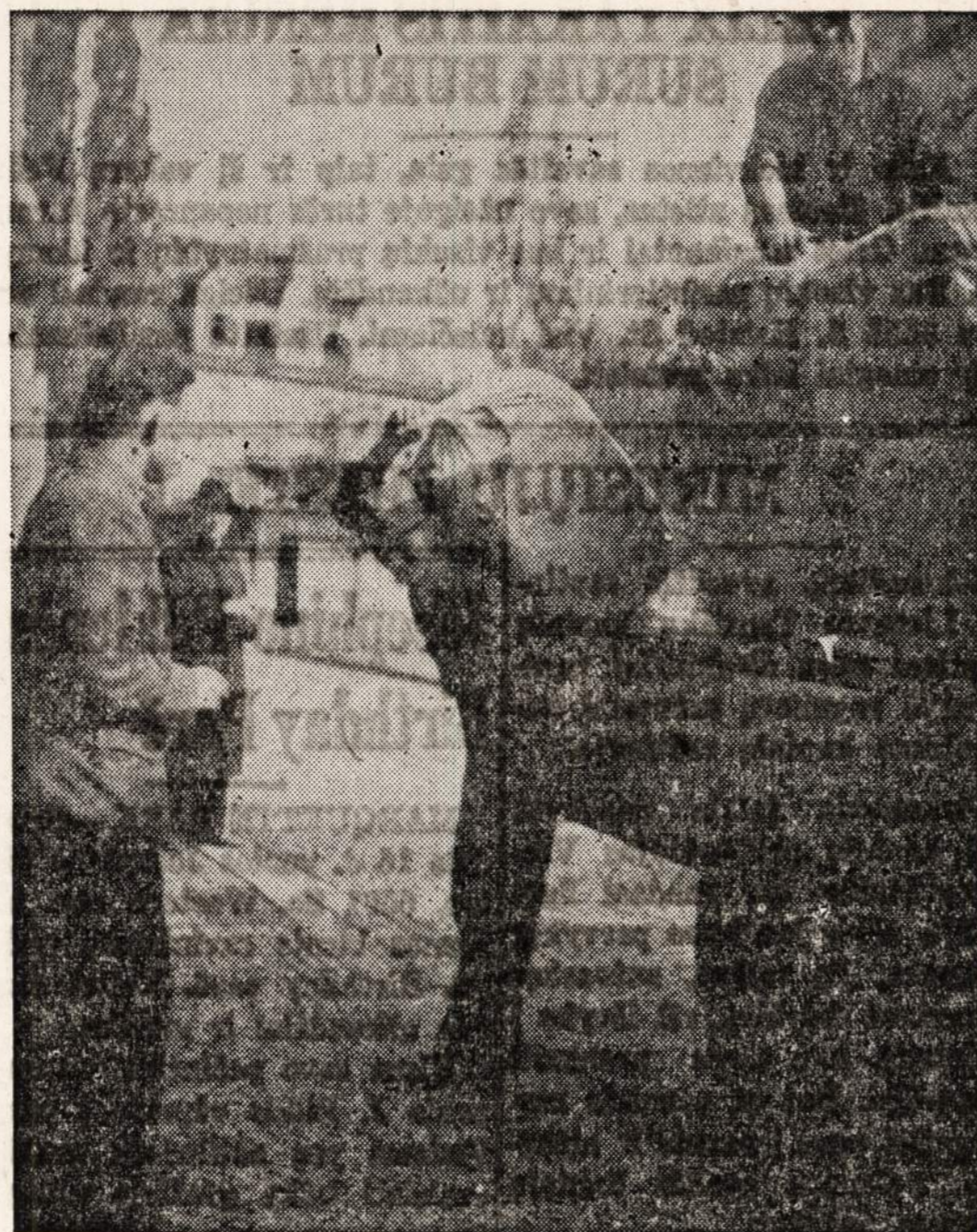
Lietuviai tremtiniai Munchene, Vokietijoje, iškrauja mašinos drabužių, gautų iš BALF'o sandėlio. Šie drabužiai suaukoti geraširdžių Amerikos lietuvių. Drabužiai ir avalynė dar ir dabar labai reikalingi. Savo dovanas siųskite Bendrajam Amerikos Lietuvių Šalpos Fondui, 105 Grand St., Brooklyn 11, N. Y.

"Draugas" gal ir vargsta Kanados valdžios "priespaudoje". Mat, jo namas tik dviejų aukštų ir kambarių mieste yra dar gražesnių negu jo. Jis pasiryžęs važiuoti į T. Lietuvą: ten esą daugiau laimės. Ten vistiek anot jo, duos sriubos ir