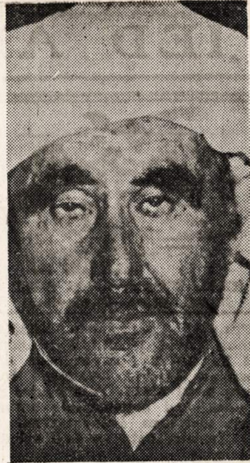
Abd el Krim kalba Kairo mieste, Egipte. Tai išgarsėjęs rificių vadas, kuris prieš 25 metus kovojo su prancūzais ir ispanais.

Dvi Chicago's pieno kompanijos skundžiasi, kad jas trukdo ir joms keblumų sudaro Grand Jury tyrinėjimas. Grand Jury tyrinėja kainų kilimą aukštin. Ta kryptimi tyrinėjami ir šių dviejų pieno kompanijų rekordai.