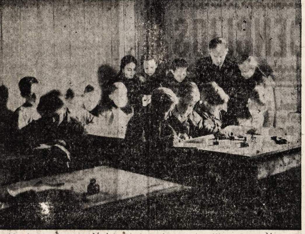
Li. Kempfeno (Vokiečioje) Lietuvių Tautos Bendruomenės gimnazijos II klasės mokiniai pamokų metu. Mažiems mokslėiviams reikia ne tik maisto, bet popieros, paišelio, rašalo miltelių, plunksnų ir kitų mokykloms reikmenų. Savo aukas siųskite BALF'ui, 105 Grand St., Brooklyn 11, N. Y.