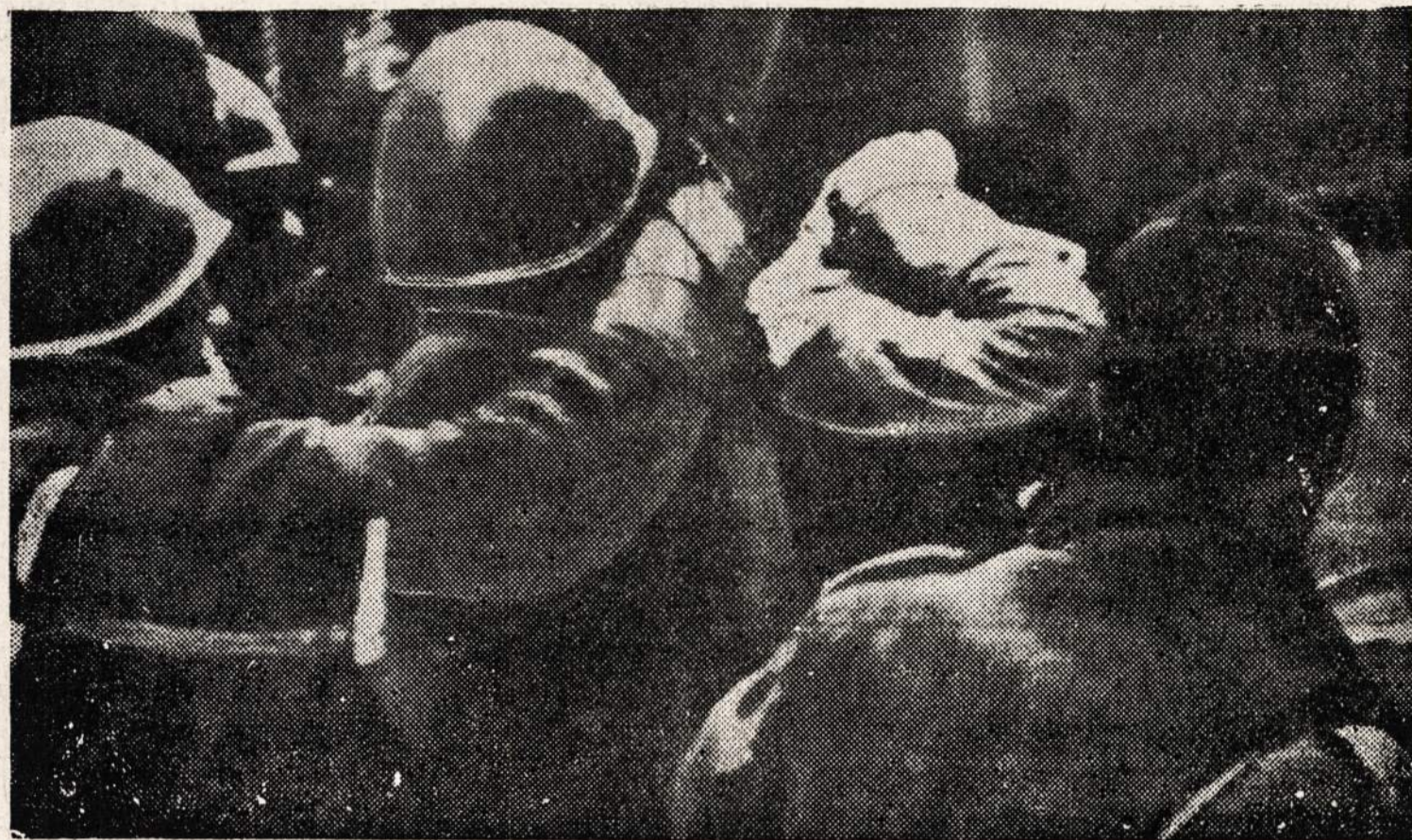
Romoje policija suima komunistą, kuris dalyvavo demonstracijoje ir kėlė netvarką.