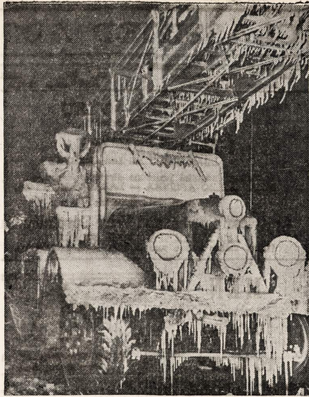
MILWAUKEE. — Tiek buvo šalta, kad gaisrininkų motoras, vandens aplietas, užšalo.

Visai teisingai sakai. Vokiečių okupacijos metu buvo projektuojama išvežti ir įjungti į Reicho darbus apie 300,000. Pradžioje šis skaičius buvo mažesnis. Ir visgi apie 30,000 žmonių pasisekė sugauti. Daleiskime, kad iš tų 30,000 sugautų 15,000 ar tai žuvo, ar Rytprūsiose liko, ar kitur kur ne žinia. Gi likusieji gyvena D. P. teisėmis Europoje. Ir kiek iš jų grįžo? Tik keletas. Kodėl? Gal už tai, kad ten nepavojinga ir nebaisu! Juk ten demokratija diktatoriaus rankose; žmonijos