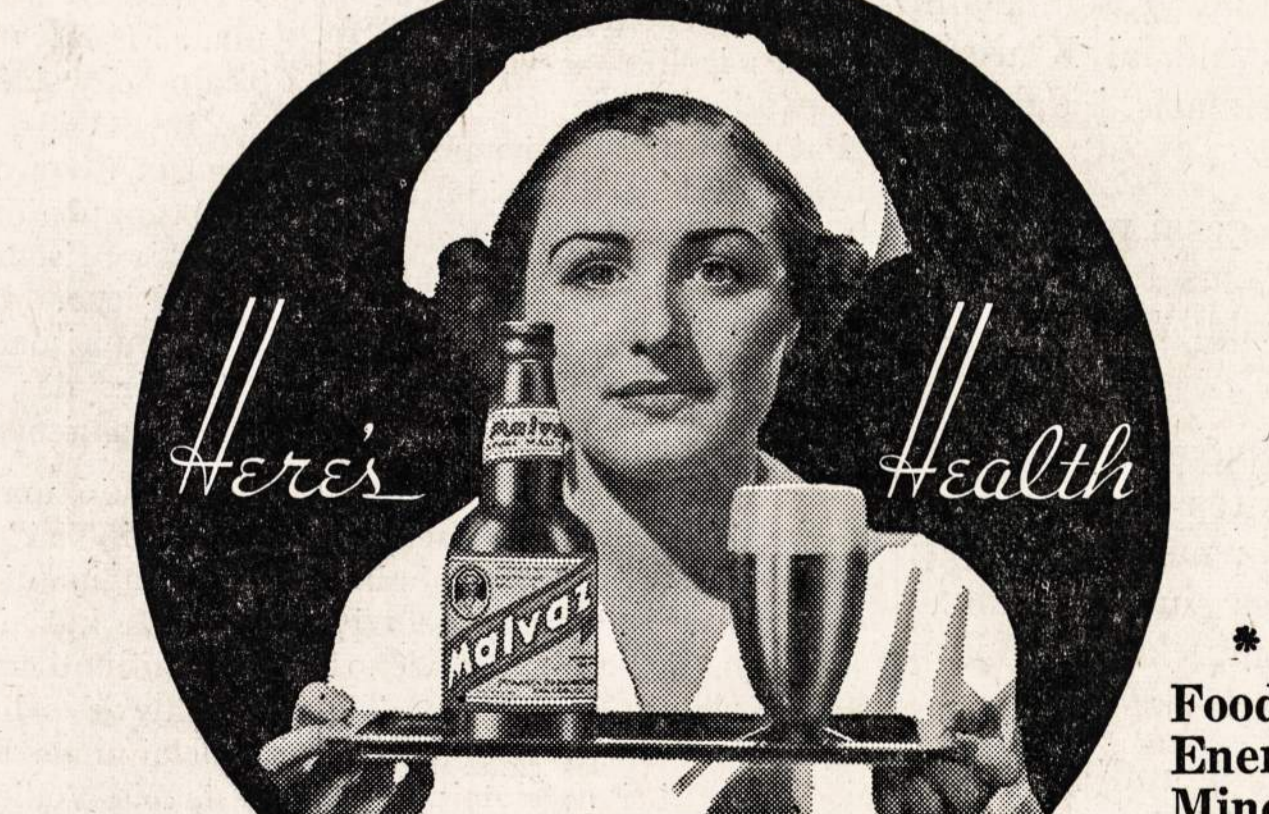
Pardavinėjimas Malvaz galimas tiktai Illinois Valstijoje.

Priduokite energijos savo sistemai... PABANDYKIT MALVAZ ŠIANDIEN!