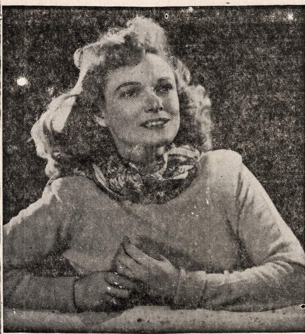
ANNA NEAGLE, current leader of popularity polls among British movie-goers, and remembered for her diversified roles in "Irene," "No, No, Nanette," "Nurse Edith Cavell," and "Victoria the Great," again comes to American audiences in "Piccadilly Incident," distributed in the United States and Canada by M-G-M.