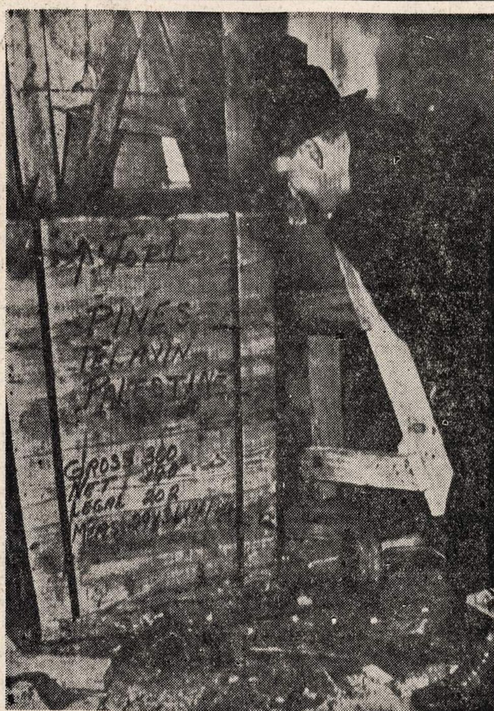
Jersey City (N. J.) uoste buvo užtikta 65,000 svarų dinamito. Dinamitas buvo skirtas Palestina. Dabar vedamas tyrinėjimas ir bandoma surasti kaltininkai, kurie šmugelio keliu bandė tą dinamitą išgabenti į Palestiną.