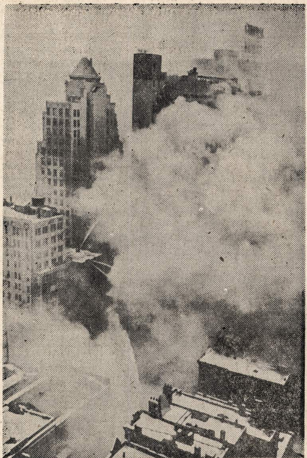
New Yorko miesto darbininkai dirba, kad galėtų atsteigti judėjimą. Kiap žinia, miestą padengė 25 su viršum colių sniego klotas. Naujų Metų dieną ėmė lyti ir šalti, kas dar labiau sugadino trafiką.

Northwestern Universitetas 1948 metais turi $358,000 pašal-