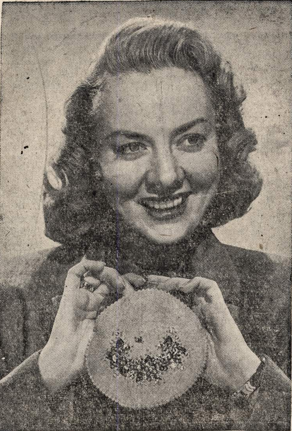
AUDREY TOTTER, whose next picture is M-G-M's "High Wall" opposite Robert Taylor, carries all of the items that she might need during the day in her purse. Her compact is covered with an attractive protective case made of green suede trimmed with colorful sequins and stones.

jiems nugabenti. Žydo bandymas priartėti prie Raudų Sienos reiškia mirtį, arabai kontroliuoja tradicinę žydų šventovę.