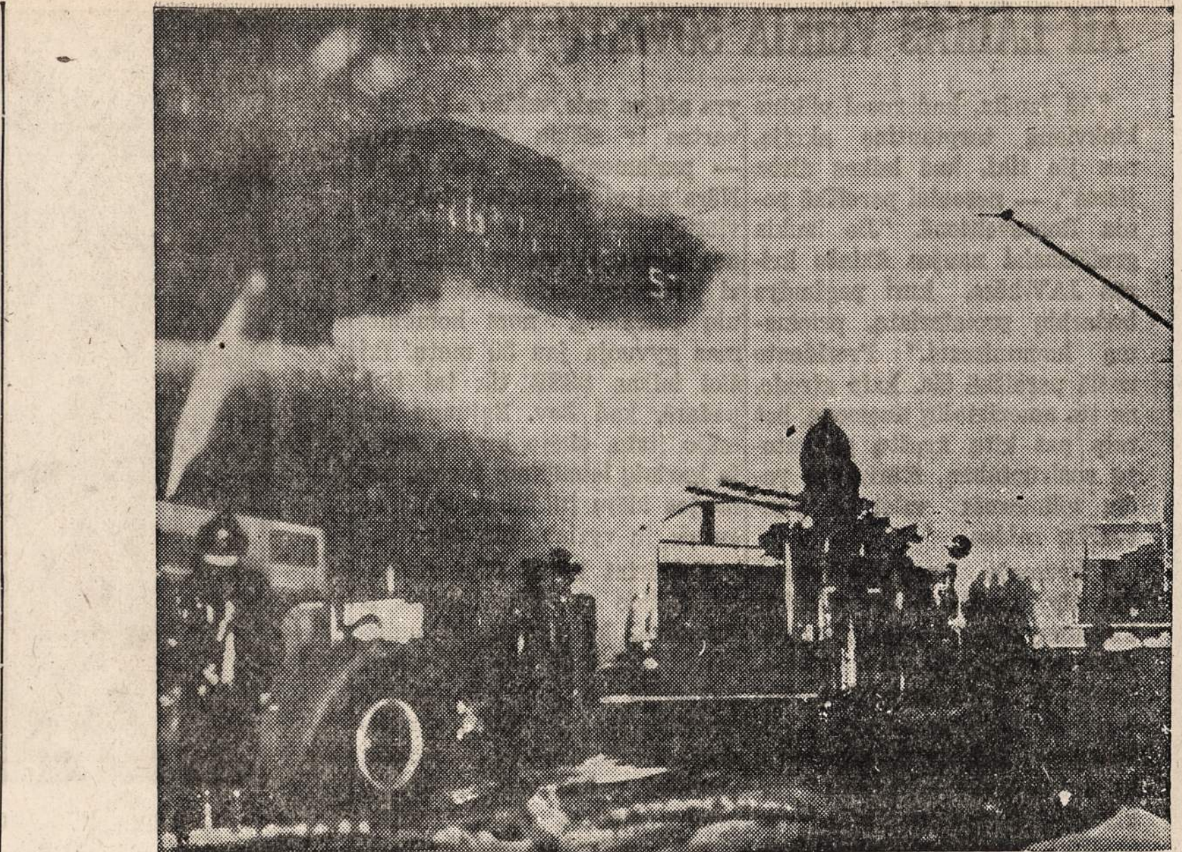
Gaisras Brooklyno (N. Y.) uoste. Dėl gaisro keli žmonės nukentėjo, — vieni lengviau, o kiti sunkiau apdegę.

To prašmatnaus, turtingo vakariečių kultūros miesto centre buvo tarp daugelio viena slėptuvė greta austrų kultūros židinio ir jų pasididžiavimo — Vienos operos pastato.