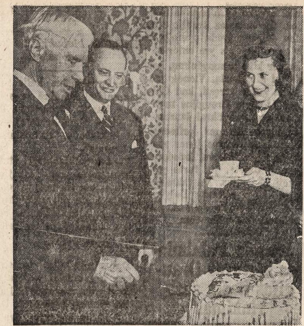
Carl Sandburg piauna tortą, kurį jam iškėkė Knox kolegijos studentai (Galesburg, Ill.). Sandburg, kuris yra garsus poetas ir Lincoln biografas, gimė Galesburge ir mokėsi Knox kolegijoje.

1918 m. susikūrus valstybei pati tauta ir vadai nežinojo ką veikti ir kuriuo keliu eiti. Senos tradicijos pranyko be pėdsakų, naujų nebuvo. Tas tuoj pat aiškiausiai pasireiškė iš valstybės pavadinimo. Pirmojo parlamento metu buvo pasiūlyta ir nutarta vadintis "Deutsch-Osterreich" ir tik St. Germaino sutartimi pavadinimas buvo pakeistas į "Osterreich".