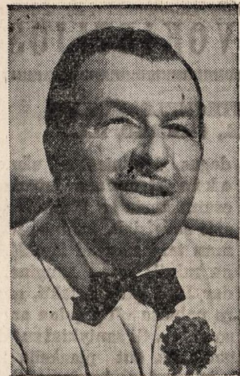
Xavier Cugat

dystai pasigauna Lietuvos partizaną. Pagautasis yra vietoje teismas. Teismo procedūra. Uždeda lentą ant galvos ir per tą lentą muša su kirviu. Po to, partizanui netenka pasiaiškinti, kas jam atsitiko. Protokole lieka pažymėta, kad velionis bėgo nuo arešto ir šoko iš antro aukšto; stačia galva atsiumšė į lentą ir nuo to mirė staigia mirtimi.