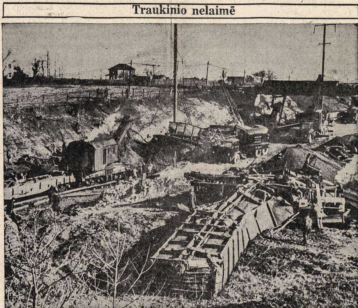
NORRISTOWN, PA. — Traukinys, susidedęs iš 124 vagonų, nūšoko nuo bėgių. 30 vagonų susidaužė ir išbarstė anglį, kurią vežė traukinys.

Sekretorius įrodinėjo komitetui nariams, kad pirmiems penkiolikai mėnesių 6 bilijonai ir 800 milijonų dolerių būtina reikalingi.