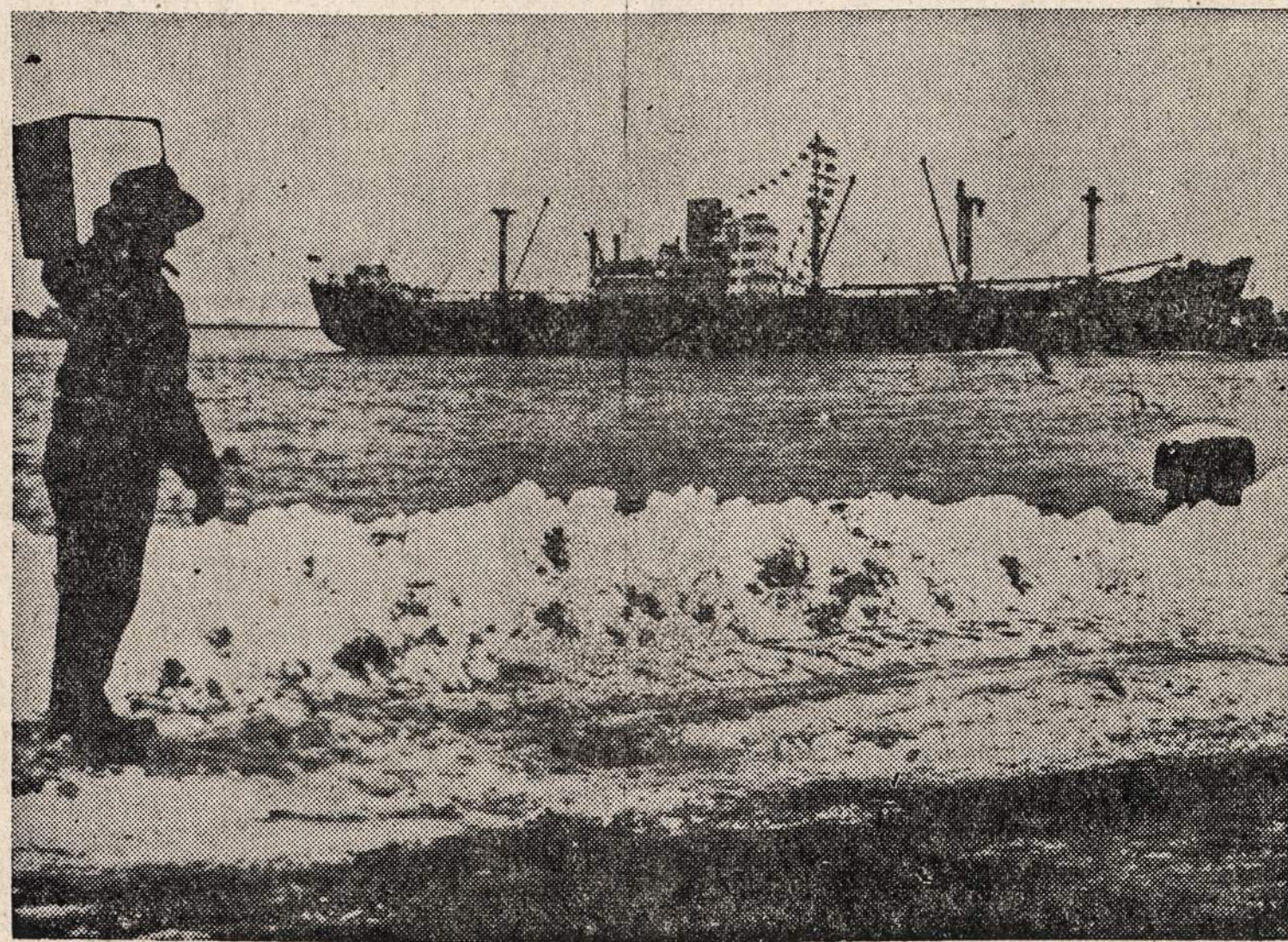
Doko darbininkas pasivėlina su dėze maisto, kuris buvo skirtas Škotijos biednuomenei. "Yankee Friend Ship" apeidžia Bostono uostą su $1,200,000 vertės maistu ir drabužiais.