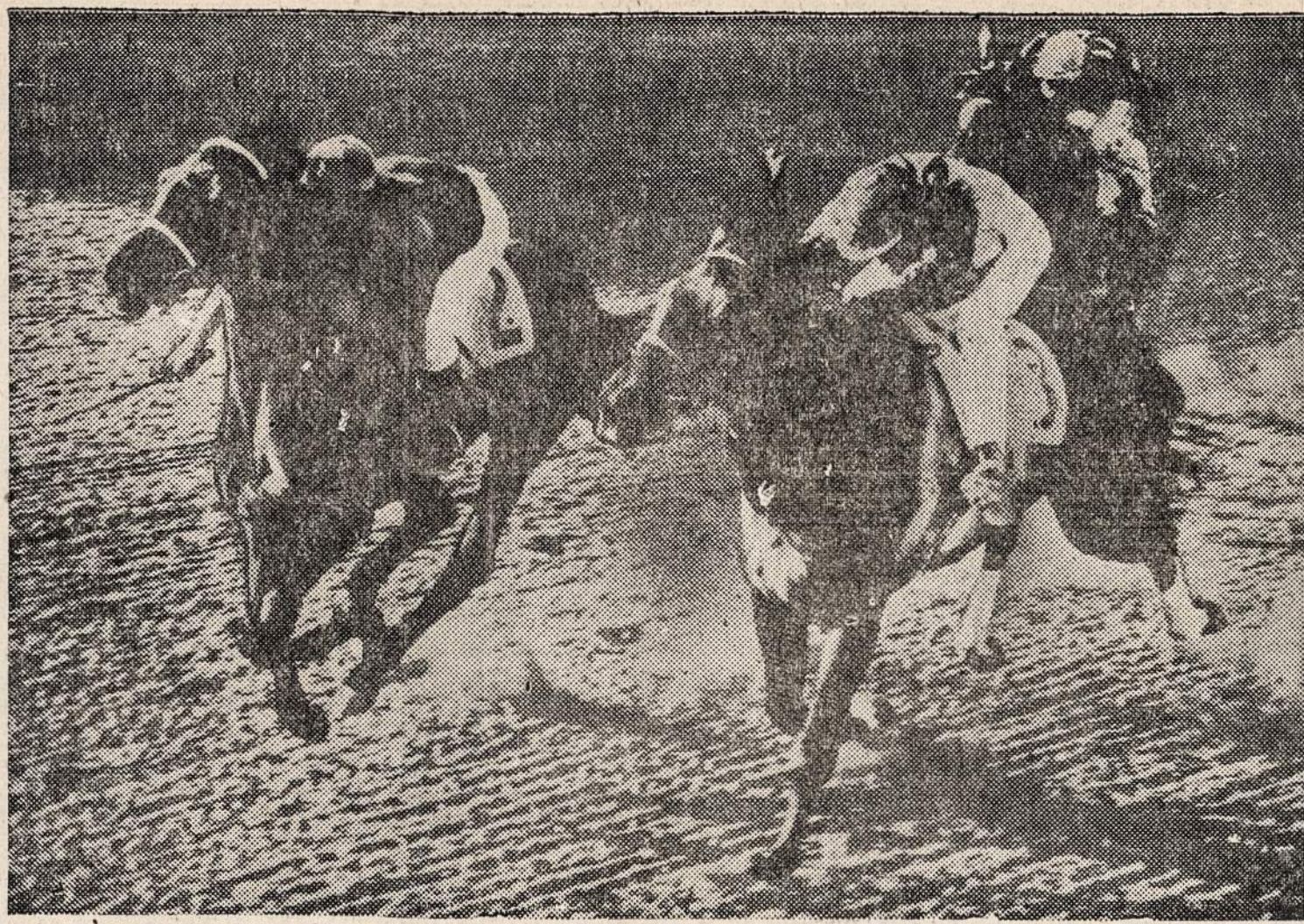
GULFSTREAM PARK, Miami, Fla.— Arklių lenktynėse Rampart (2) užima pirmą vietą.

Ne, jei jūs pamatytumėt dabar tą operos solistę nuskurusią, vargo prislėgtą, jei jūs pamatytumėt jos vėjo nuplūstą veidą, jos grubias rankas—nieku būdu nepatikėtumėt, kad kada nors šis moteris scenoje dainavo... Jei jūs matytumėt pulkininko žmoną nudrįskusią, su įdubusiais išbadėjusiais veidais, su rankų sąnariais patinusiais, jei jūs girdėtumėt jos balsą, kuris lyg iš po žemės sklinda ir