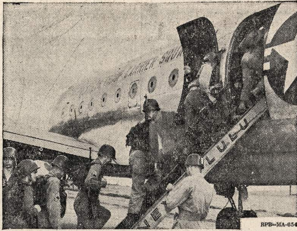
Speed and precision in boarding a troop carrier plane constitute the final phase of training in the Air Transportability School at Fort Gulick, Panama Canal Department. The student-soldiers receive thorough instruction in theory, administration, and actual flight — which gives them a working knowledge of troop and materiel movement by air. Many other Army Ground Forces schools are available to qualified Regulars.