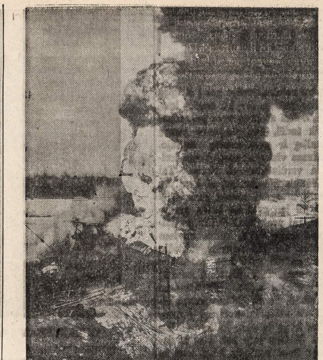
Battle Creek, Mich., įvyko traukinių nelaimė, kurios metu žuvo trys geležinkelio tarnautojai. Užsidedę traukinių įtūgti alicjais tankai.

Kongresas priėmė ir pasiuntė prezidentui įstatymą, kuris leidžia valstybės departamentui vesti žodžių karą su Rusija. Praeitais metais kongresas apkarpė sekretoriaus Marshall prašomąs šūnas.