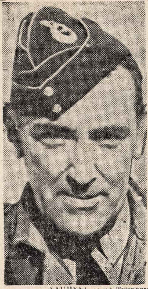
Britų aviacijos maršalas Arthur Cunningham žuvo lėktuvo nelaimėje. 30 Amerikos lėktuvų ieško tarp Azorų salų ir Bermudų prapuolusio keleivinio britų lėktuvo.