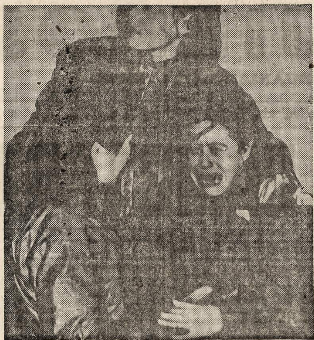
SANCHAJUS, Kinija. — Kabaretų šokėjai sukėlė riaušes, protestuodami prieš valdžios pasisąjimą uždaryti visus kabaretus. Riaušėse dalyvavo 8,000 asmenų, iš kurių 500 buvo areštuoti.

PAVASARINIS Naujienų Parengimas Bus suvaidinta 3 aktų veikalas "PASLEPTI TURTAI" SOKOL SALEJE 2343 So. Kedzie Ave. KOVO-MARCH 7, 1948