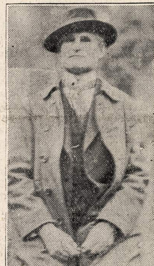
DR. K. GRINIUS nepriklausomos Lietuvos atstatymo metu.

—Jie gali ir turi daug aktyviau toje kovoje dalyvauti, — sako dr. Grinius. — Jei nekreips reikiamo dėmesio dabar, tai vėliau gali būti per vėlu. Lietuvių gali sulaukti to paties li-