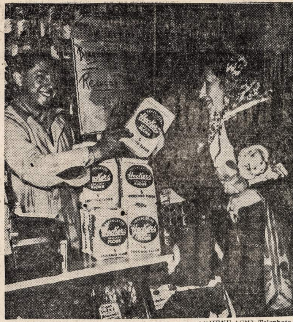
New Yorko maisto krantuose miltai pradėta parduoti žymiai pigesniais kainomis.

—Kolumbijoj įvyko susirėmimas tarp policijos ir riaušiniukų, 9 asmenys užmušti, 21 sunkiai sužeistas.