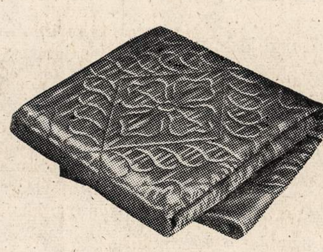
Westinghouse Electric Comforter—Choice of rose, blue and green quilted satin comforter with non-slip back, removable warming sheet, double bed size, $49.85.*

*Including Federal Excise Tax. COMMONWEALTH EDISON COMPANY