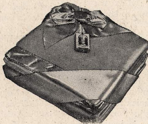
General Electric Automatic blanket—High quality fabric in soft pastel shades of rose, blue, green or cedar, double bed size, $39.85.*

Nauji elektriniai blanketai ir comforters yra gaunami visokių spalvų, kurie pritiktų miegruimui arba spalvų suderinimui. Pamatykite tuos naujus elektrinius blanketus ir comforters pas jūsų dylerį arba artimiausioj Edison krautuvėj šiandien ir sužinokite apie šį modernišką miegojimo patogumą.