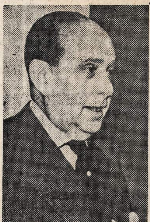
Jan Masaryk, Čekoslovakijos užsienio reikalų ministeris, kuris Pragoje papildė savizudystę, išsokdamas pro langą.

—Varšuvos valdžia reikalauja grąžinti Kanadon atvežtus lenkų meno darbus, bet pavelsių saugotojai nenori jų duoti dabartinei valdžiai.