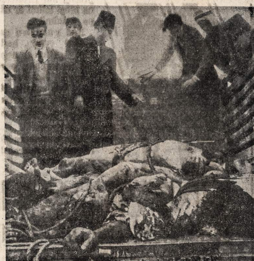
Žydų organizacijos Haganah narių sukrūvinti lavonai. Arabai (sunkvežimyje) pagavo žydus į spastus. Kai pradėjo artintis anglai, tai arabai pagautus žydus nužudė. Kruvini susirėmimai tarp žydų ir arabų Palestinoje vis dar tęsiasi.