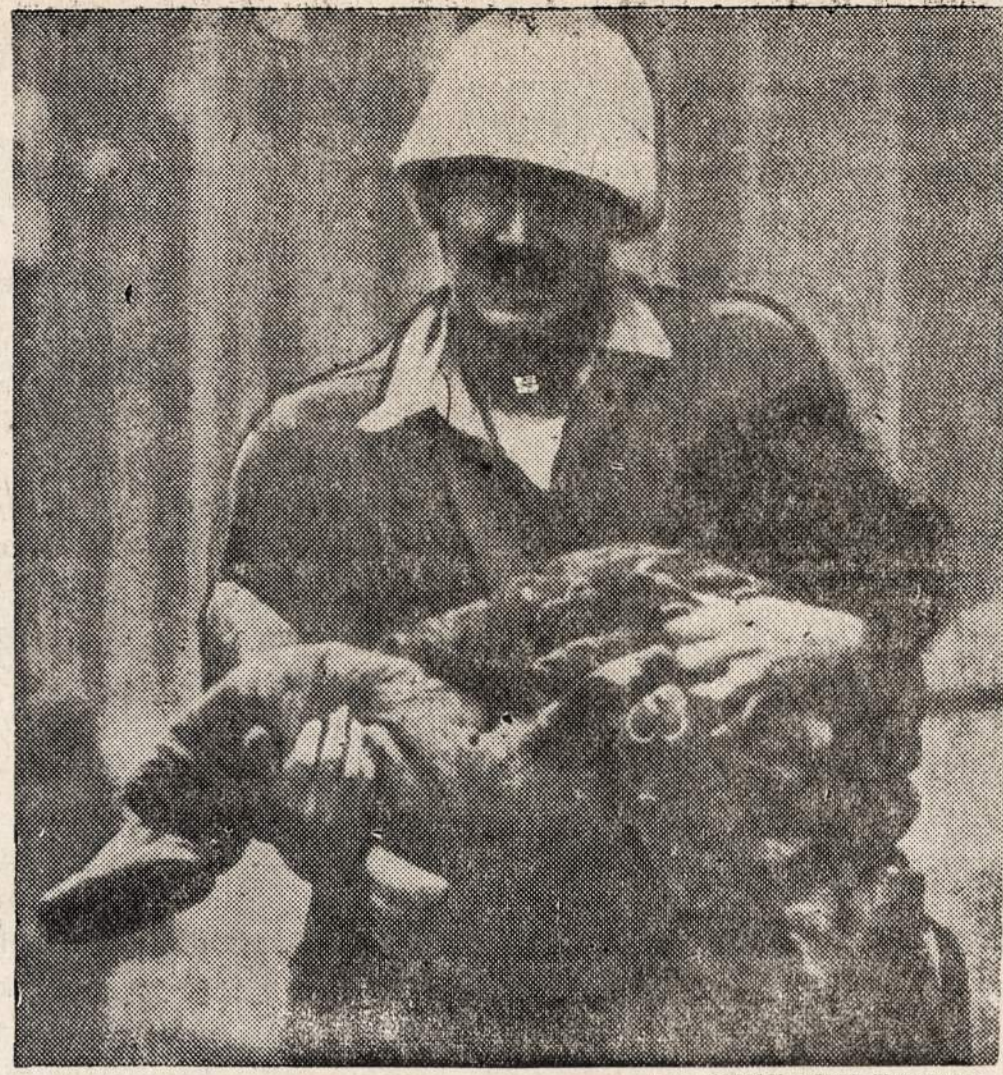
TSINGTAO, KINJA. — Didelio amunicijos sandėlio eksplozijoje, kaip apskaičiuojama, žuvo apie 100 žmonių. Amerikos jūrininkai gelbsti eksplozijos aukoms.

Tačiau programos išspausdinimas nėra vieno žmogaus reikalas. Tai nėra nei mano, nei kieno kito asmeniškias dalykas. Tai yra visuomeniškas reikalas, todėl visuomenė (o ypačiai darbo žmonių reikalams pritariančioji visuomenė) privalo prie