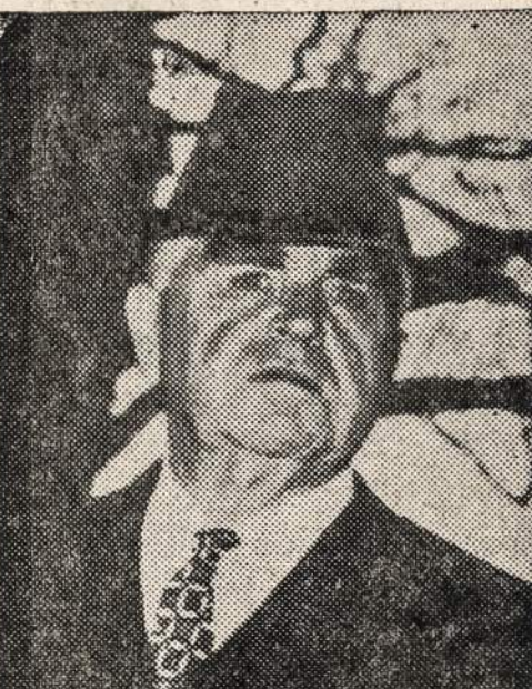
John L. Lewis, angliakasių vad. Anglių kompanijos rengiasi federaliame teisme iškelti jam bylą, jeigu jis neįsakyta angliakasiams grįžti į darbą.