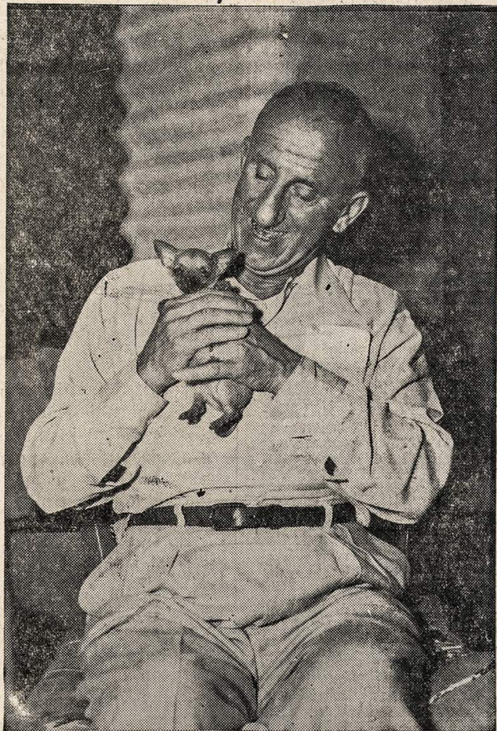
JIMMY DURANTE looks with admiration at Chita, Xavier Cugat's pint-sized pooch. "Wit ears like dem, I could be a double sensation, declares Jimmy, caught between scenes of his latest M-G-M film, "On An Island With You." The cast of the technicolor musical includes Esther Williams, Peter Lawford, Ricardo Montalban and Cyd Charisse.