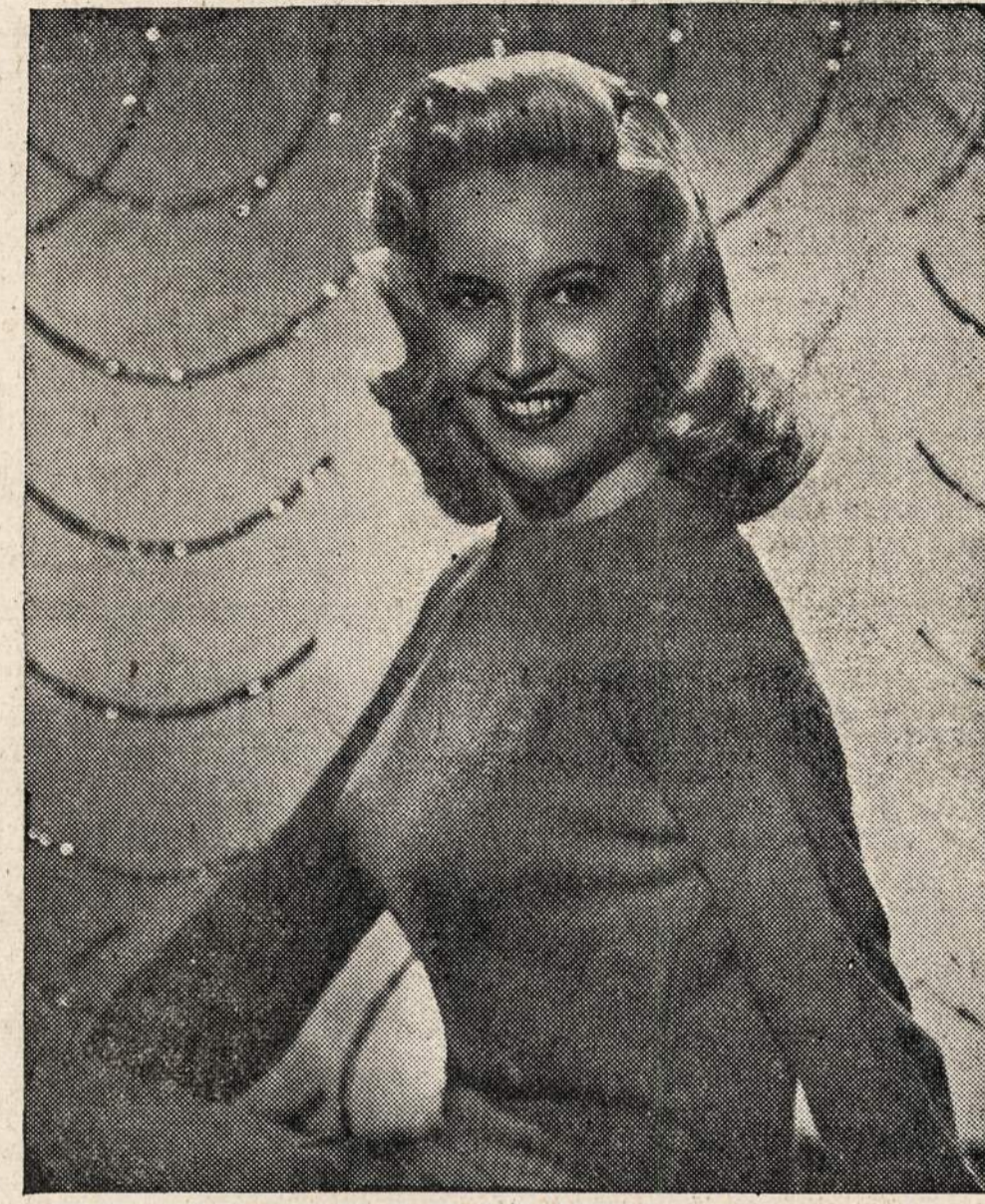
THIS BLONDE M-G-M BEAUTY has been seen in a number of "Dr. Gillespie" pictures opposite Van Johnson, was in "The Show-Off" with Red Skelton and "High Barbaree" with Van, and will be seen next with Mickey Rooney in "Summer Holiday." Is She— 1. Betty Grable 2. Marilyn Maxwell 3. Audrey Totter 4. Marie McDonald (Marilyn Maxwell)