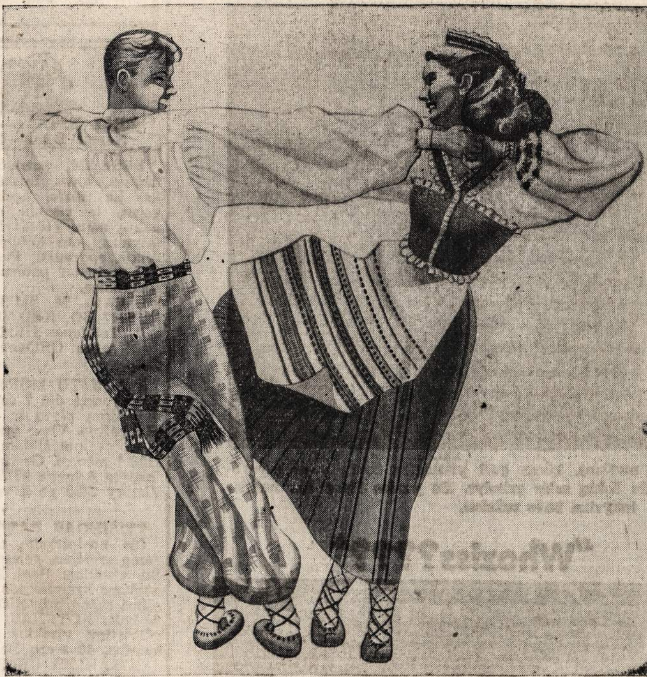
(Roberto Treonio piešinys)

"Kubilas" yra lietuviškas šokis, aplink kubilą šokamas.