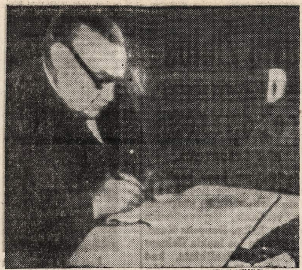
Britų užsienių reikalų ministras Ernest Bevin pasirašo 50 metų pakta, kurį Briuselyje priėmė Anglija, Prancūzija, Belgija, Liuksemburgas ir Olandija. Paktas vyriausiai yra nukreiptas prieš komunistų pasimojimą pavergti Europą.