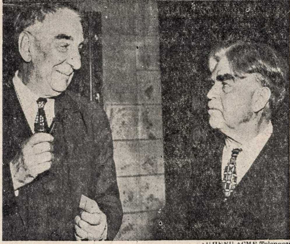
Federalis taikymo direktorius Cyrus Ching (po kairei) tariasi su John L. Lewis, angliakasių unijos prezidentu. Ching bando sutaukyti angliakasius su kasyklų savininkais ir tuo būdu likviduoti prasidėjusį streiką.