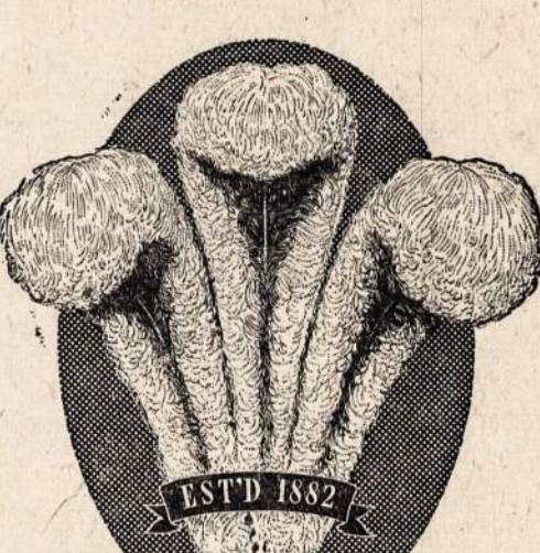
Judge its GENIAL CHARACTER