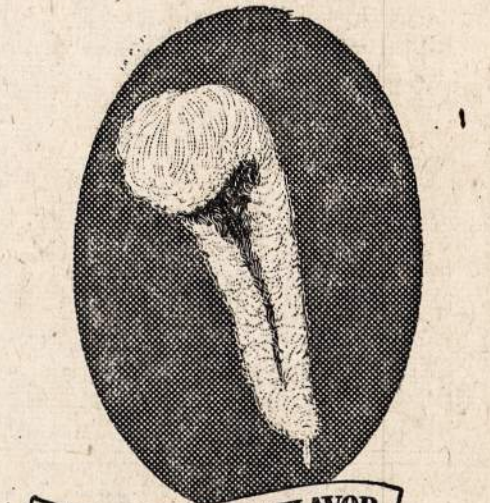
Judge its NOBLE FLAVOR

NOW TRY THE GREAT 65 TH YEAR THREE FEATHERS