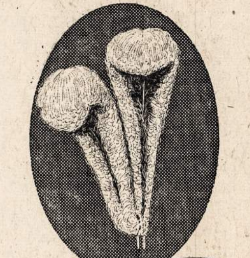
Judge its RARE BOUQUET