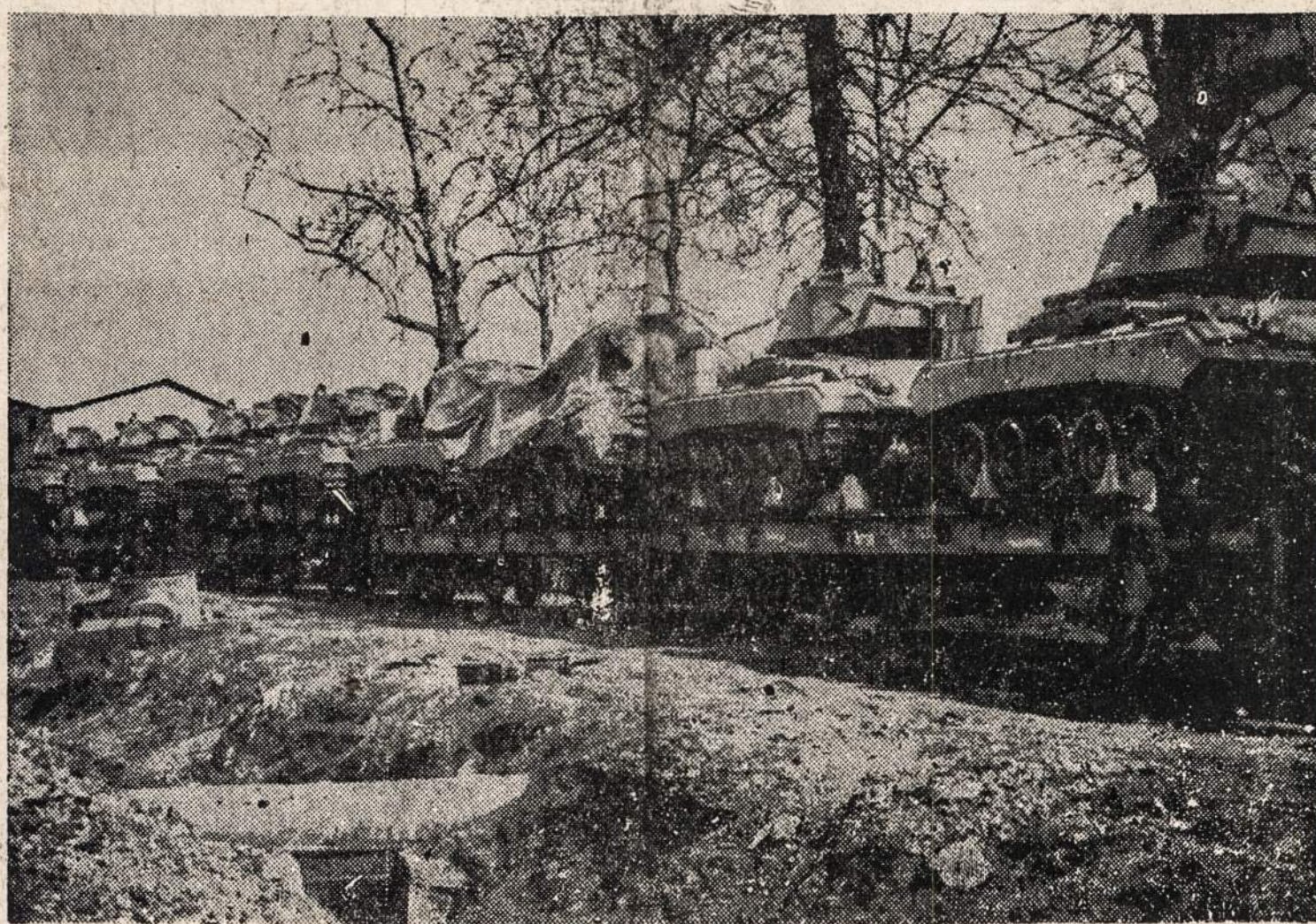
DERICE, TURKIJA. — Turkija iš Amerikos gavo lengvųjų tankų transportą. Tai pirmas rusišes transportas, pasiekęs Turkiją, kuriai, be tankų, yra siunčiami armijos sunkvežimiai, „džipai“ ir amunicija.