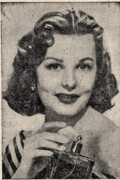
WHAT girl wouldn't be pleased over a Valentine gift of matching cologne and perfume! Arlene Dahl, who will be seen soon as Van Johnson's girl friend in M-G-M's "The Bride Goes Wild," shows the correct way to spray a mist of cologne with an atomizer bottle.

ir jo iš kitų surinktos aukos būtų prigingavimu būdu panaudotos visai kitam tikslui, negu jos buvo renkamos.