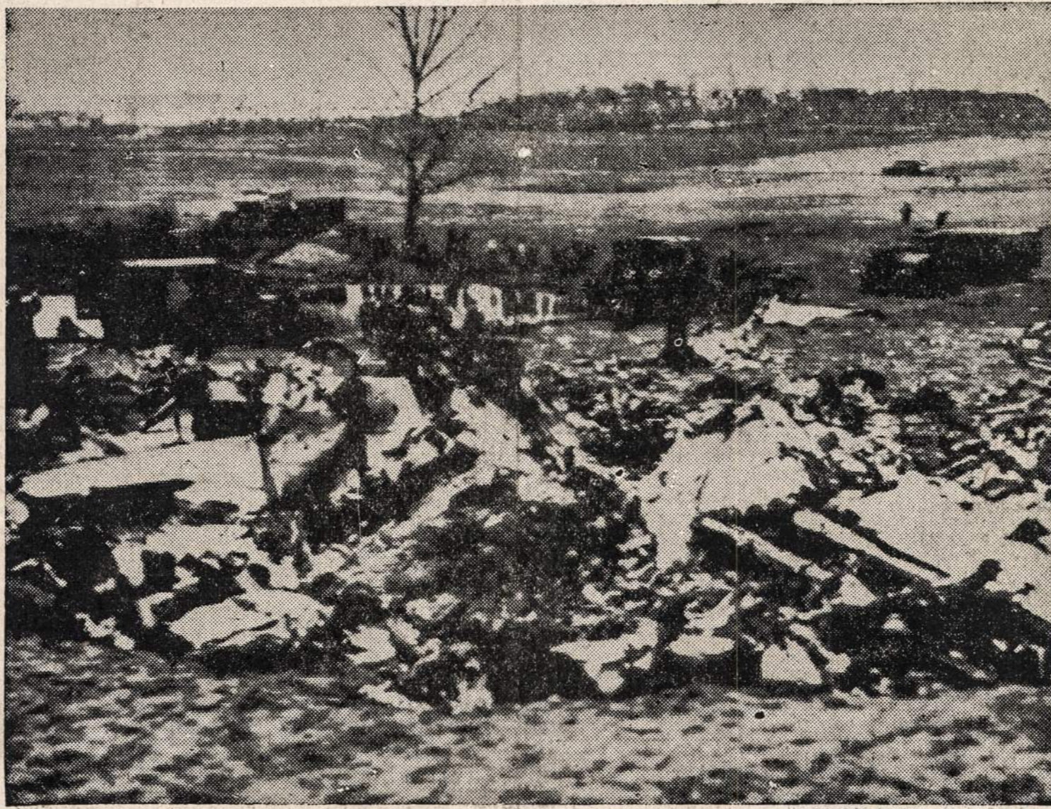
Rusų lėktuvas smogė į besileidžiantį Berlyne anglų pasażierinį lėktuvą, kuris tuoj užsidegė. Žuvo 14 žmonių, kurių tarpe buvo ir du amerikiečiai.