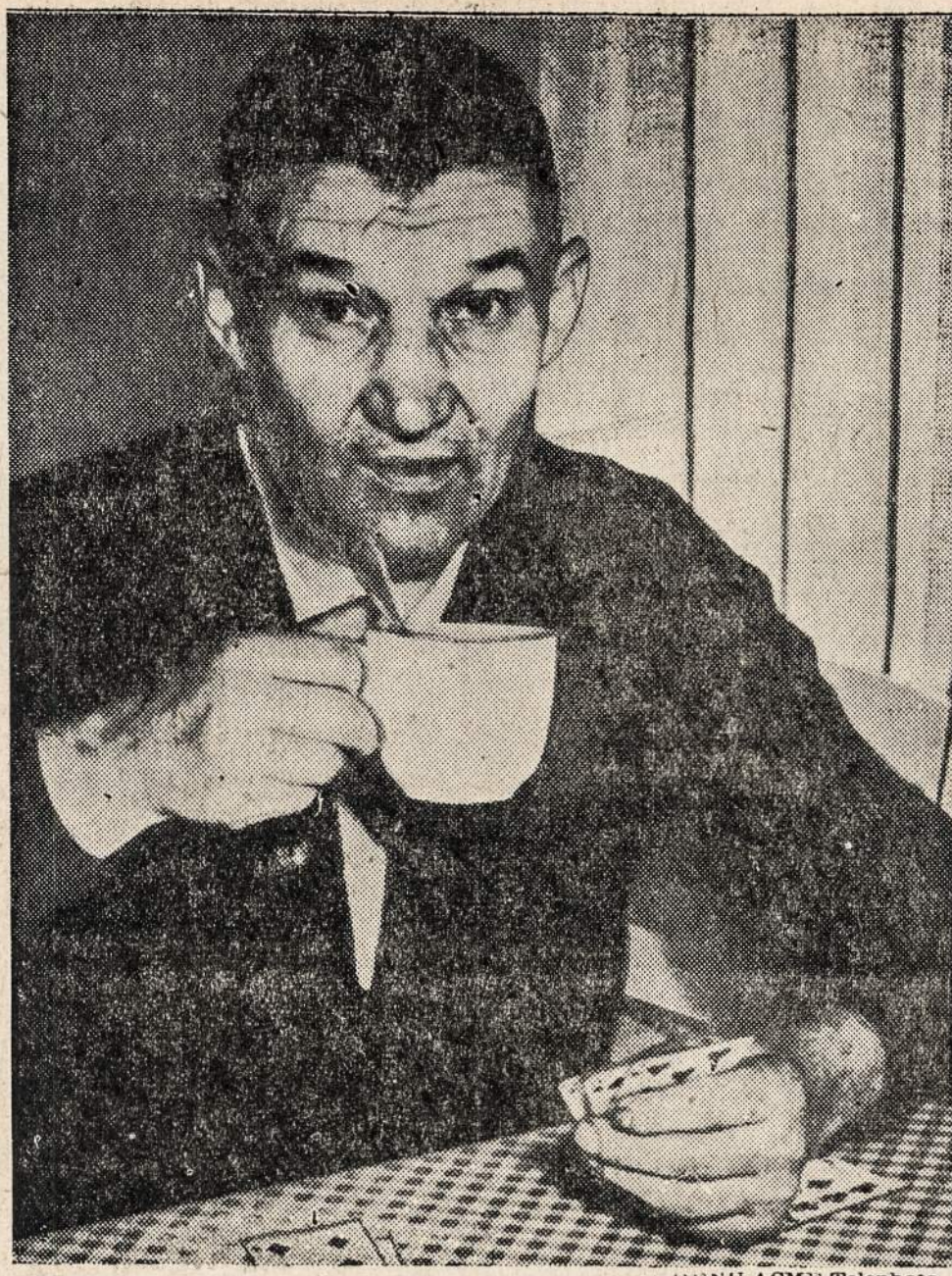
COVERDALE, PA. — Kadangi pensijos klausimu dar nesutarta, tai angliakasiai atsako grįžti į darbą.

Pirkite tose krautuose, kurio GARSINASI "NAUJIEŅOSE"