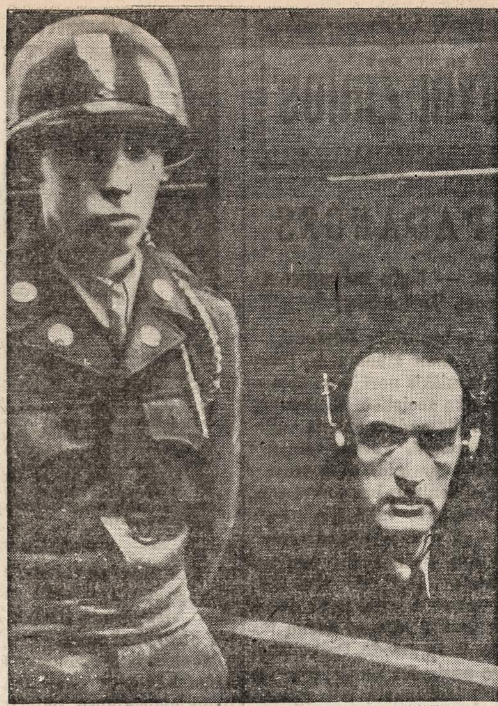
Alfred Krupp (po dešinei), prezidentas, ir 11 Krupp imonių direktoriai, tapo išteisinti Nuernberge. J. V. teismas išmetė byla, kuri kaltino juos karo samokslu.

—Myron Taylor užvakar lėktuvu atskrido į Romą.