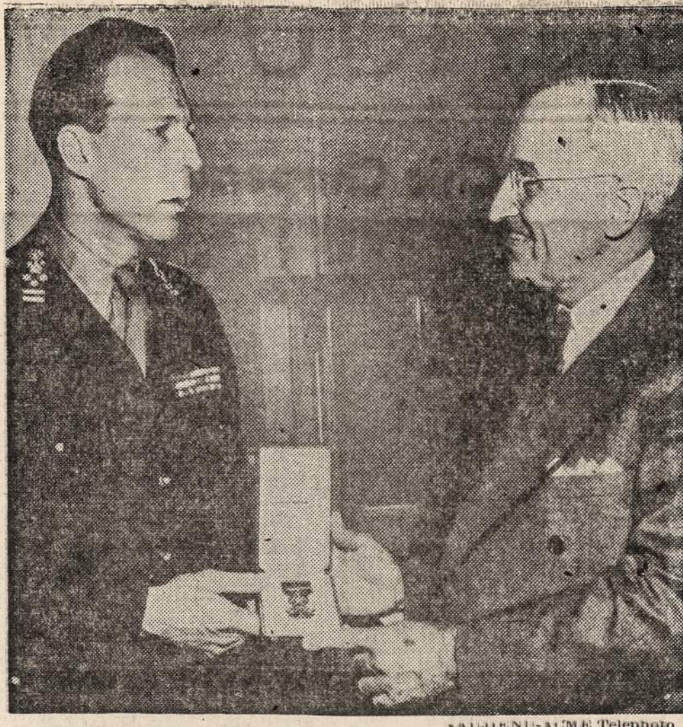
Belgijos princas regentas Charles įteikia prezidentui Trumanui Belgijos karo kryžį, kuris bus paskirtas Antrojo Pasaulinio Karo nežinomam Amerikos kariui.

Arabai atkakliai priešinasi tam, kad Palestina arba jos da-