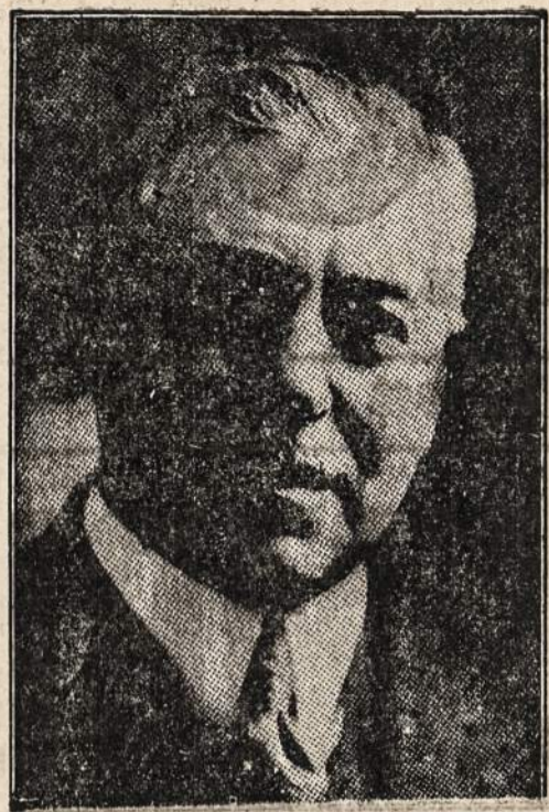
Congressman A. J. Sabath 7to Kongresinio Distrikto

Šiandien Armijos Dienos paradas vyks Chicagoje. Didysis paradas susiorganizuos 1:30 val. popiet. Eisena prasidės 2 valandą popiet State gatvėje ties Wacker Drive.