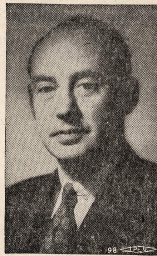
ADLAI E. STEVENSON