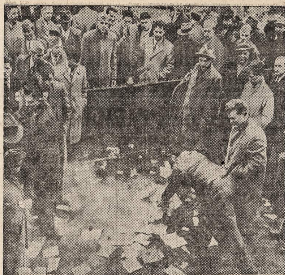
ROCHESTER, N. Y. — Apie 100 karo veteranų suardė komunistų partijos mitingą, sudraskė ir sudegino komunistų knygas ir brošiūras. Kalbėtojus, partijos darbininkus ir publiką apsaugojo policija.

Jeigu šitie dalykai bus su tvarkyti, tai komunistų demagogija nebeturės pasisekimo žmonių masėse, ir Italija virstų svarbiausiųjų narių vakarinių tautų šeimoje.