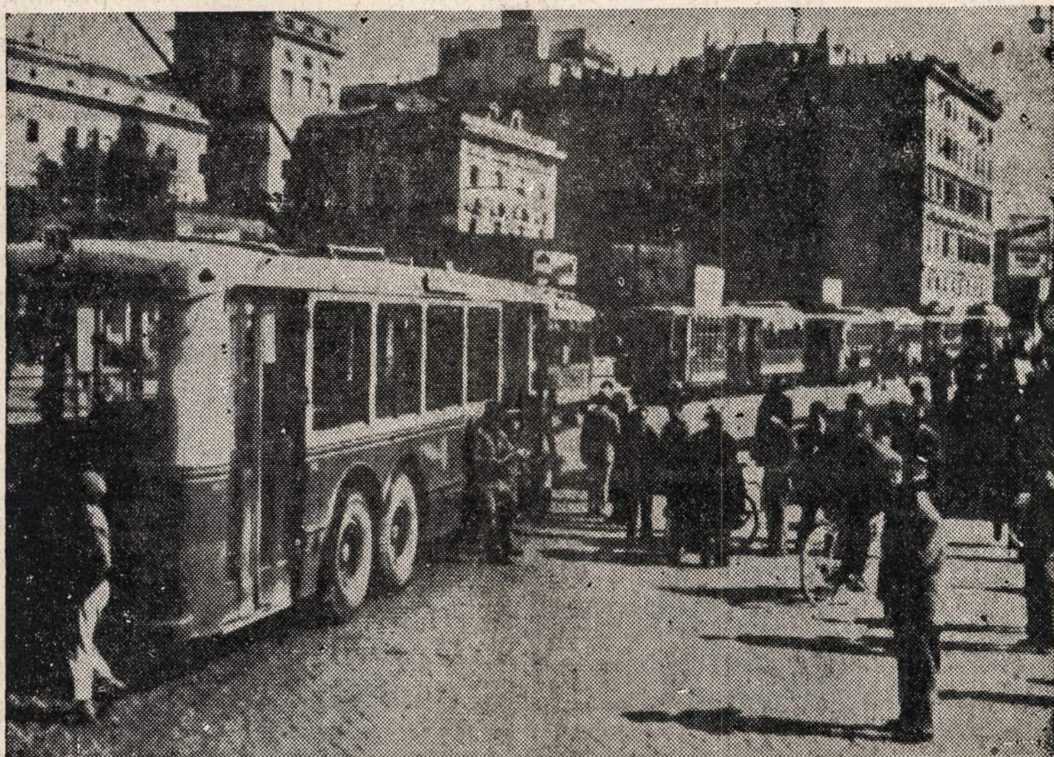
Komunistų kontroliuojamų unijų paskelbtas streikas Romoje sulaukė transportaciją vienai valandai. Vienos valandos streikas įvyko visoje Italijoje. Tai buvo savo rūšies komunistų demonstracija. Tačiau toji demonstracija nebuvo tokia įspūdinga, kokios tikėjosi komunistai.