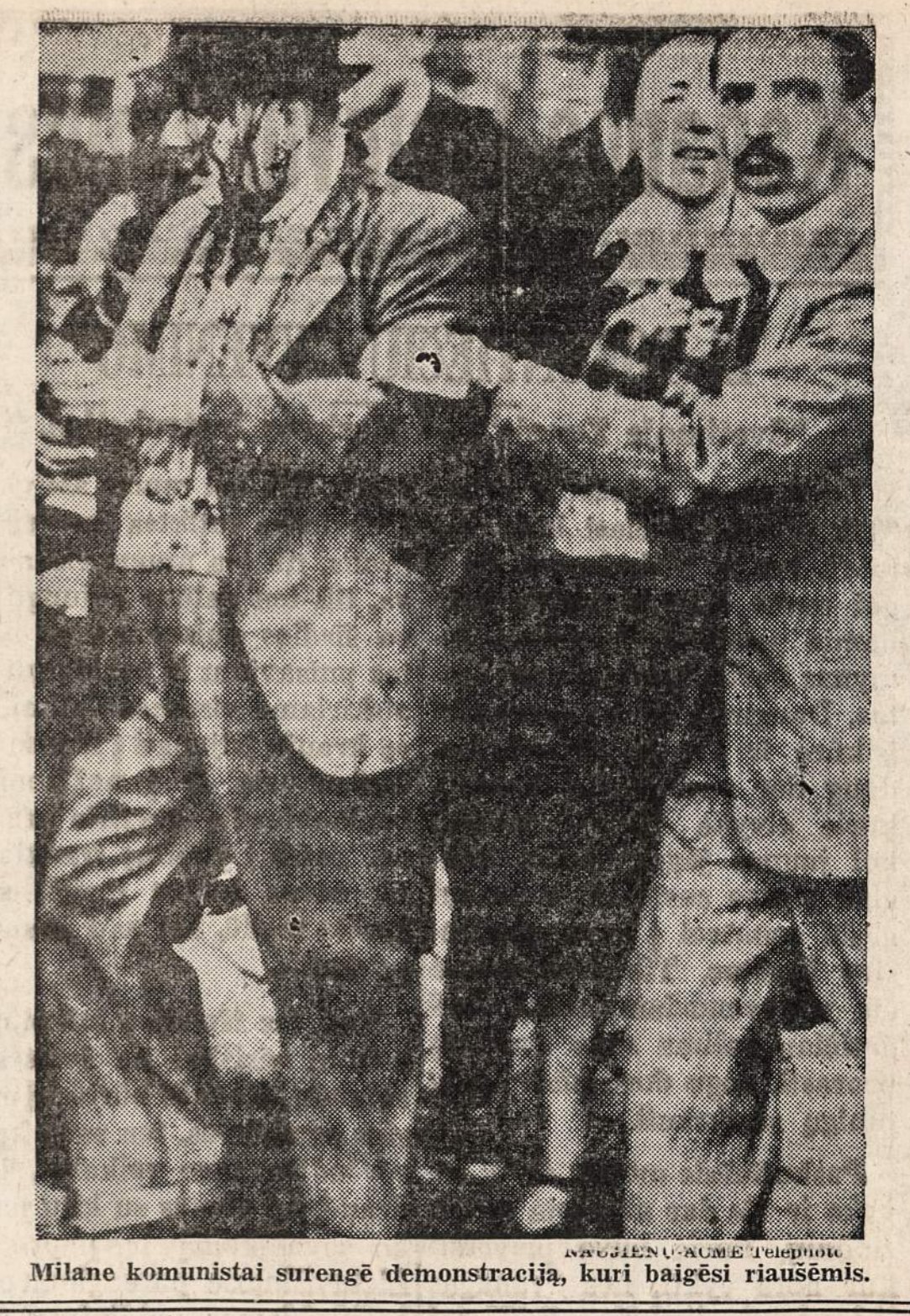
Milane komunistai surengė demonstraciją, kuri baigėsi riaušėmis.

—Ak, ir Vokietija kada tai turėjo gero muilo. Nepamirškite, — sako kitas ir čia atmintinai išvardija visas firmas, kuriuos kvepiantį muilą anuomet kvepia. Ginčijasi. Vieni linkę manyti, kad tai ami maudosi, suprask S. Amerikos pilietis, nes esą tik jie tokį gerą muilą gali turėti. Kiti linkę tvirtinti, kad gal kas nors iš tremtinių, nes jie taip pat muilo gauna. Treti — tokiems teigimams labai abejingi. Jei jau ir gauna tremtiniai muilo, tai ne tokio kvepaus. Gal seniau taip buvo, o dabar visi tremtiniai nustu-kvepaus. Gal seniau taip buvo, o dabar visi tremtiniai nustu-kvepaus. Gal seniau taip buvo, o dabar visi tremtiniai nustu-kvepaus.