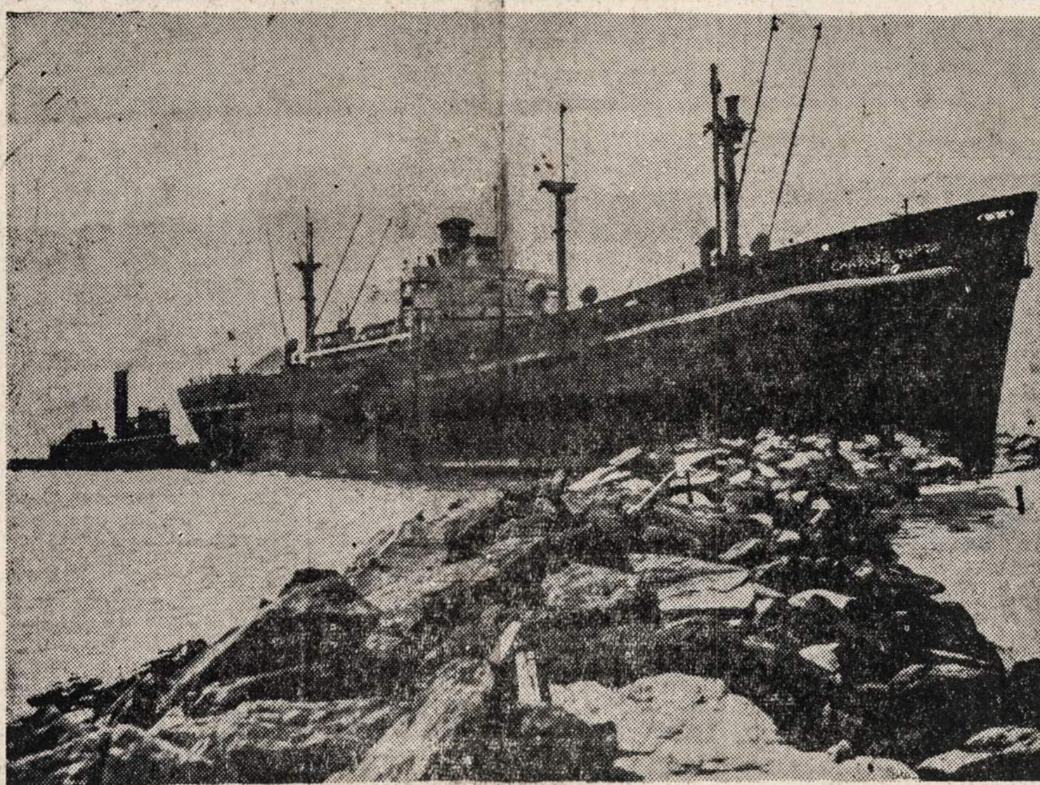
Charles Tufts "Liberty" laivas buvo užėjęs ant seklumos prie Coney Island, New Yorke.