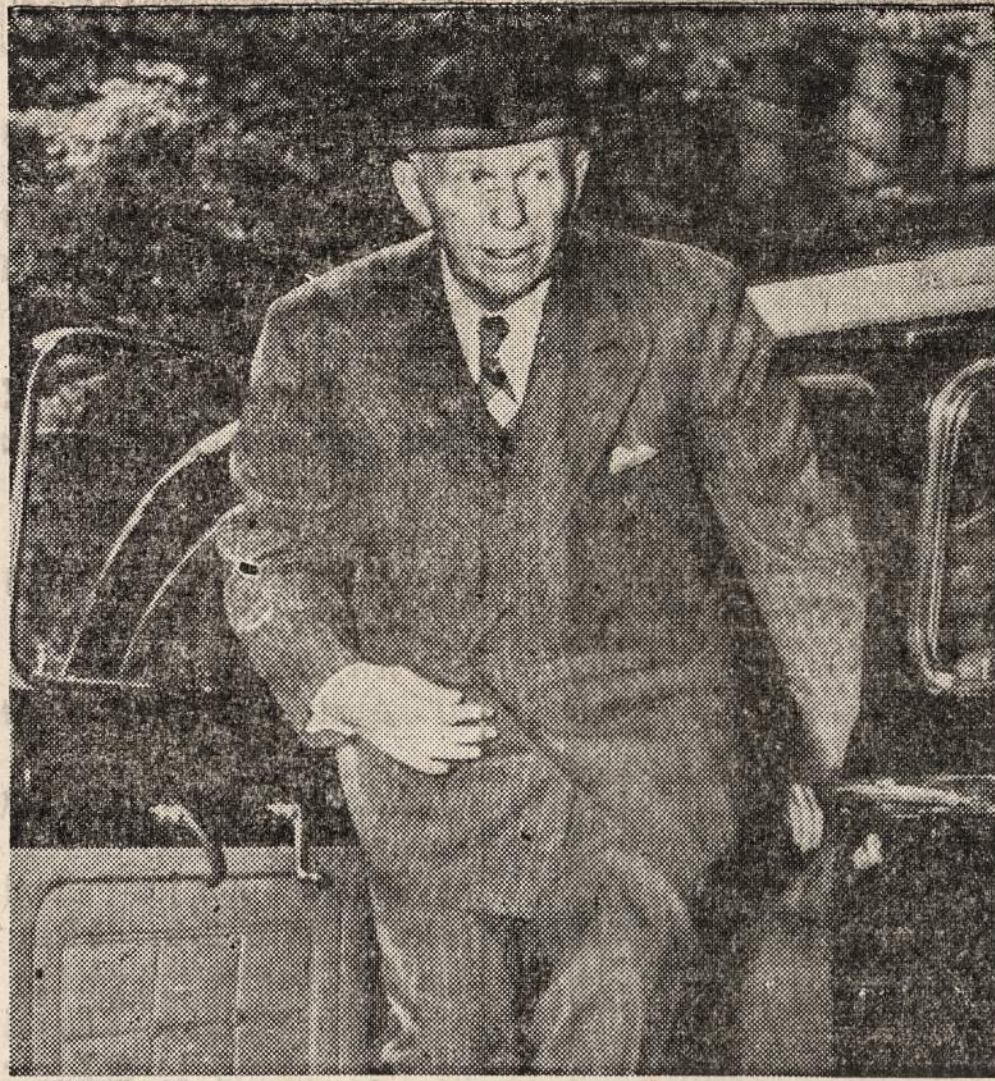
Valstybės sekretorius George C. Marshall, grįžęs iš Bogota, Columbia, vyksta į Baltuosius Rūmus pasimatyti su prezidentu Trumanu.