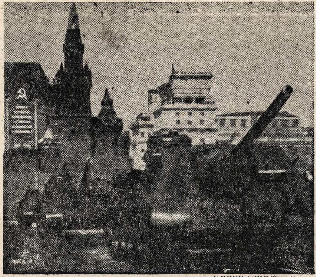
Sovietų tankai prie Lenino mauzoliejaus Raudonojoje Aikštėje 1 Gegužės demonstracijoje, kuri įvyko Maskvoje.

REMKITE TUOS, KURIE GARSINASI "NAUJIEŅŲSE"