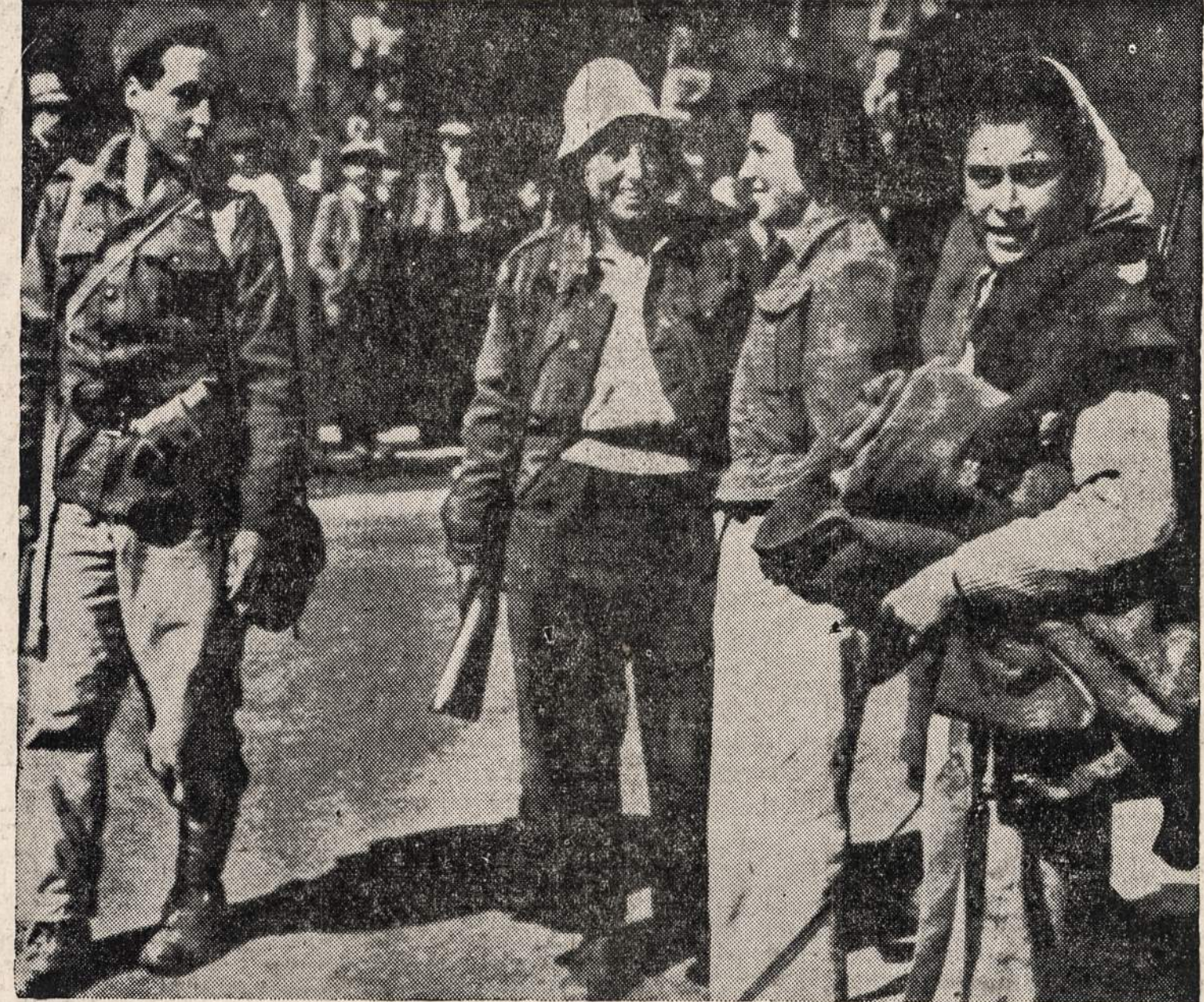
Jaunuolis ir trys moterys, kurie lydėjo kaipo sargyba 300 trokų žydų konvojų iš Tel Avivo į Jeruzalę. Konvojus su amunicija ir maistu laimingai pasiekė savo tikslą.