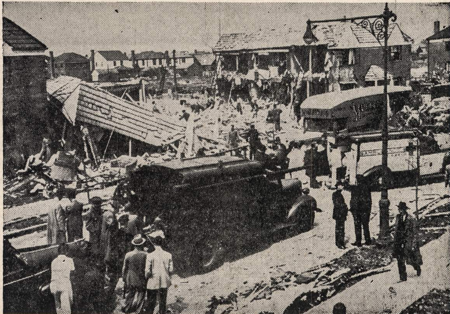
QUEENS, N. Y. — Ekspliozija, kuri įvyko, kai darbininkai ištraukė iš vietos šviečiamųjų dujų vamzdį, beveik sunaikino namą, užmušė ir sužeidė 8 asmenis.