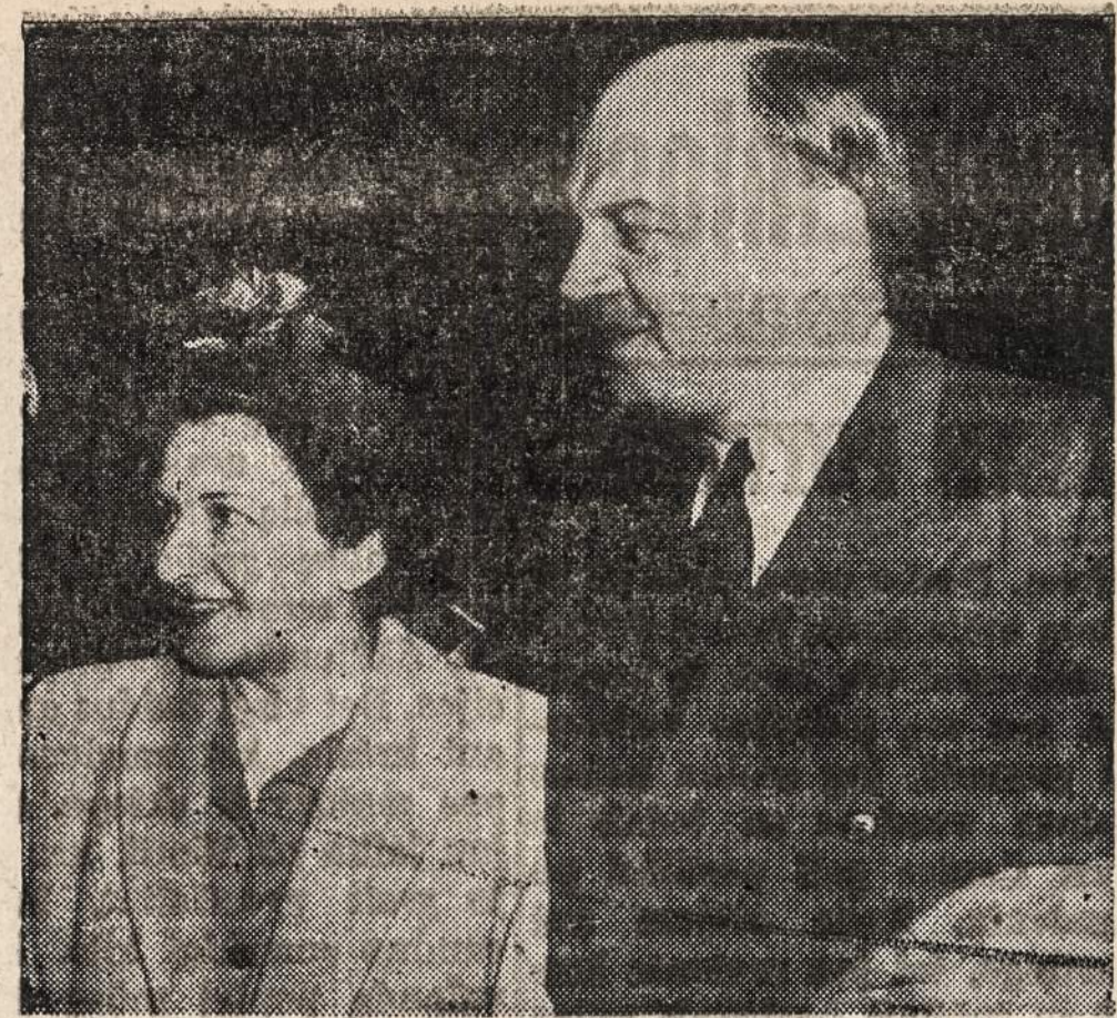
Harold E. Stassen atvyko į Clevelandą po smarkios politinės kampanijos Ohio valstijoje, kur jis bando susilpninti senatoriaus Tafto įtaką.

Birželio 29 dieną prasidedančioji byla yra nepaprastai svarbi, nes sovietų valdžia turės atsakyti už nusikaltimus, padarytus Rusijoje ir užsienyje. Maskva skelbia, kad Rusijoje yra demokratija, bet ten nėra nei žodžio, nei spaudos laisvės. Sovietų valdžia nutarė pasiųsti Paryžium didoką savo agentų skaičių.