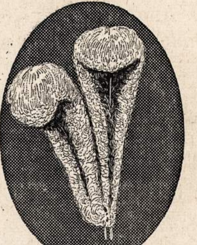
Judge its RARE BOUQUET