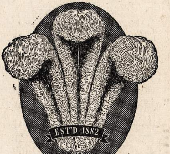
Judge its GENIAL CHARACTER

Puikiausia Three Feathers Kada Buvus Bonkose!