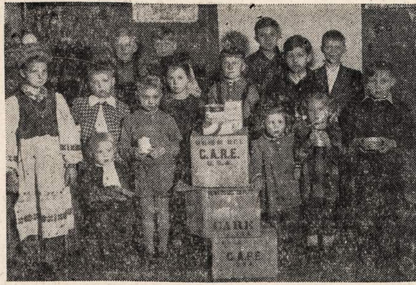
Vaikai tremtiniai džiaugiasi iš Amerikos gautais maisto siuntiniais.