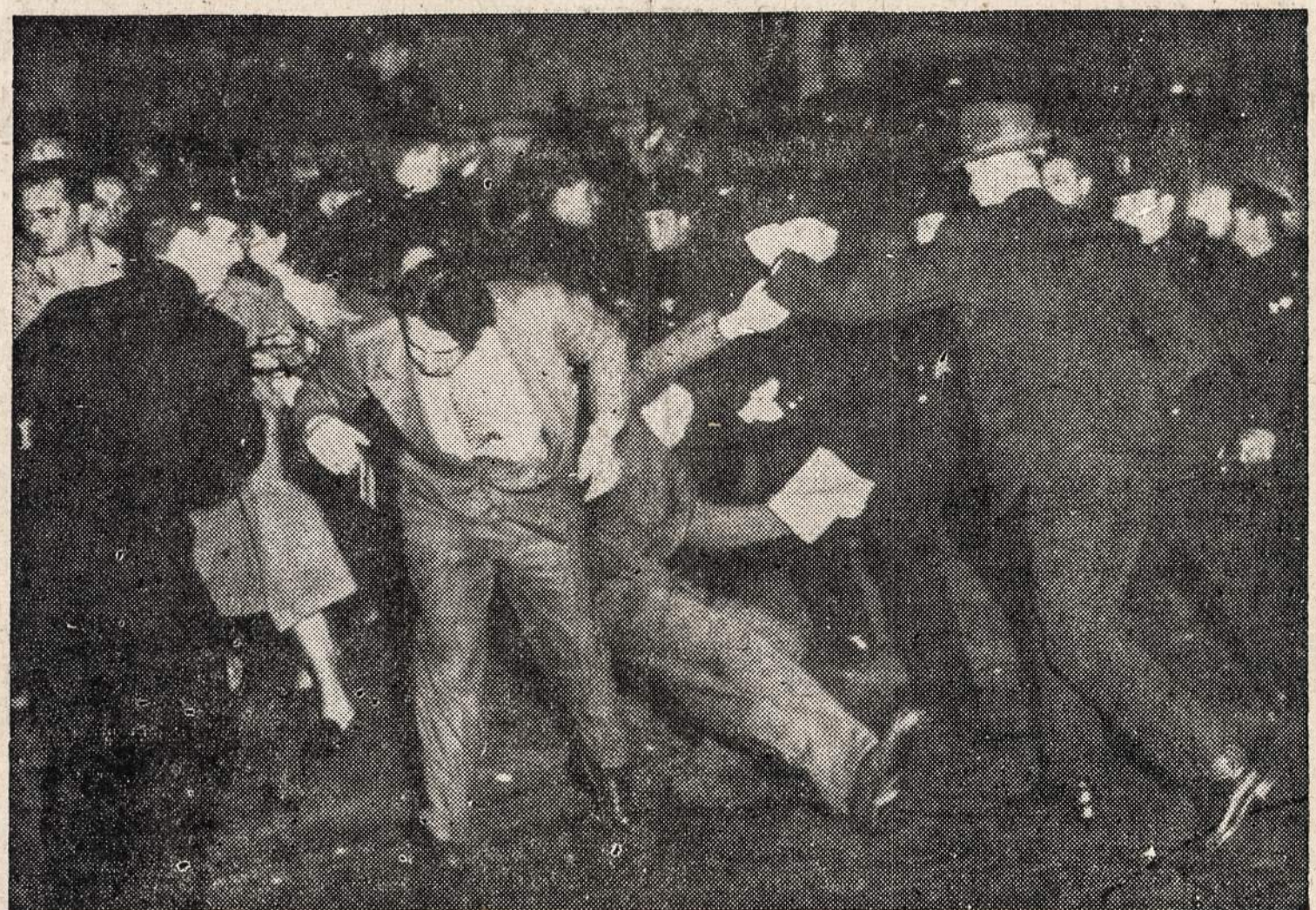
New Yorke prie Roxy teatro, kur prasidėjo rodymas filmos "The Iron Curtain" (Geležinė Uždanga), įvyko susirėmimas tarp komunistų pikietininkų ir karo veteranų.