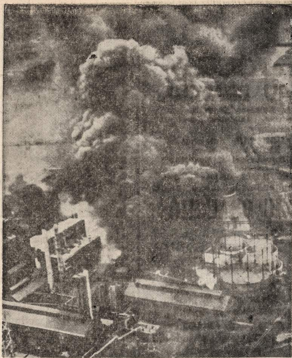
EVERETT, MASS.—Boston Consolidated Gas Converting imonėje įvyko eksplozija ir gaisras, kuris sunaikino šešis didelius pastatus ir užmušė vieną žmogų. Apskaiciuojama, kad nuostoliai sieks $4,000,000.

Amerikos Raudonasis Kryžius užlaiko Inquiry Service. Ši Raudonojo Kryžiaus darbuotės šaka palaiko kontaktą su 65 kitais kraštais ir padeda surasti ieškomus šeimas arba asmenis.