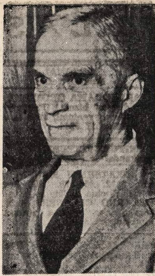
NAUJIENŲ AGENTŲ TELEFONINIS ADVOKATAS, KURĮ JUNGINĖS Tautos paskyrė Jeruzalės municipaliteto komisijonieriumi. Jo paskyrimą užgryė tiek žydai, tiek arabai.