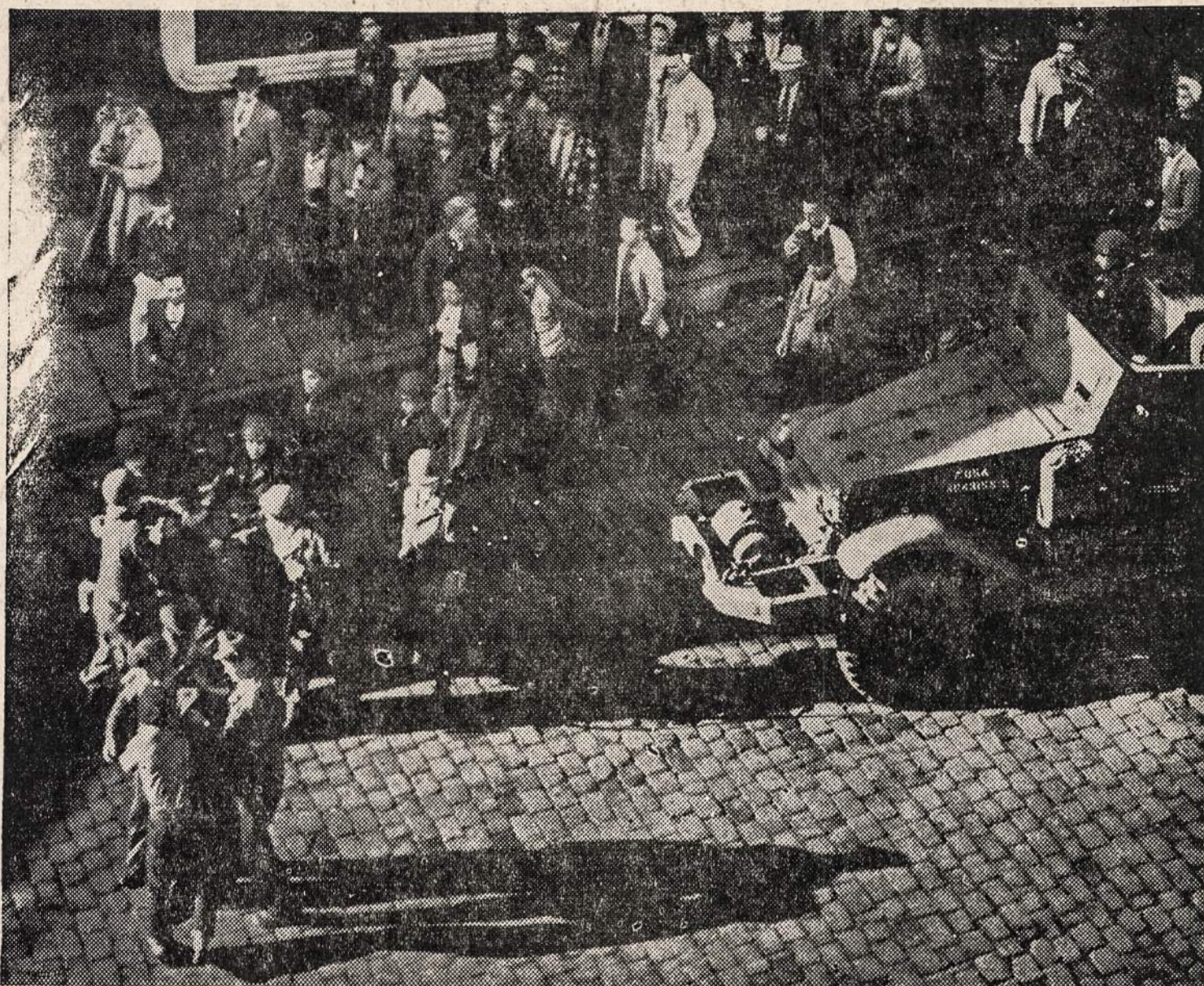
SOUTH ST. PAUL, MINN. — Nacionalės gvardijos kapitonas laiko du streikininkus, kurie nesilaikė nustatytos tvarkos.