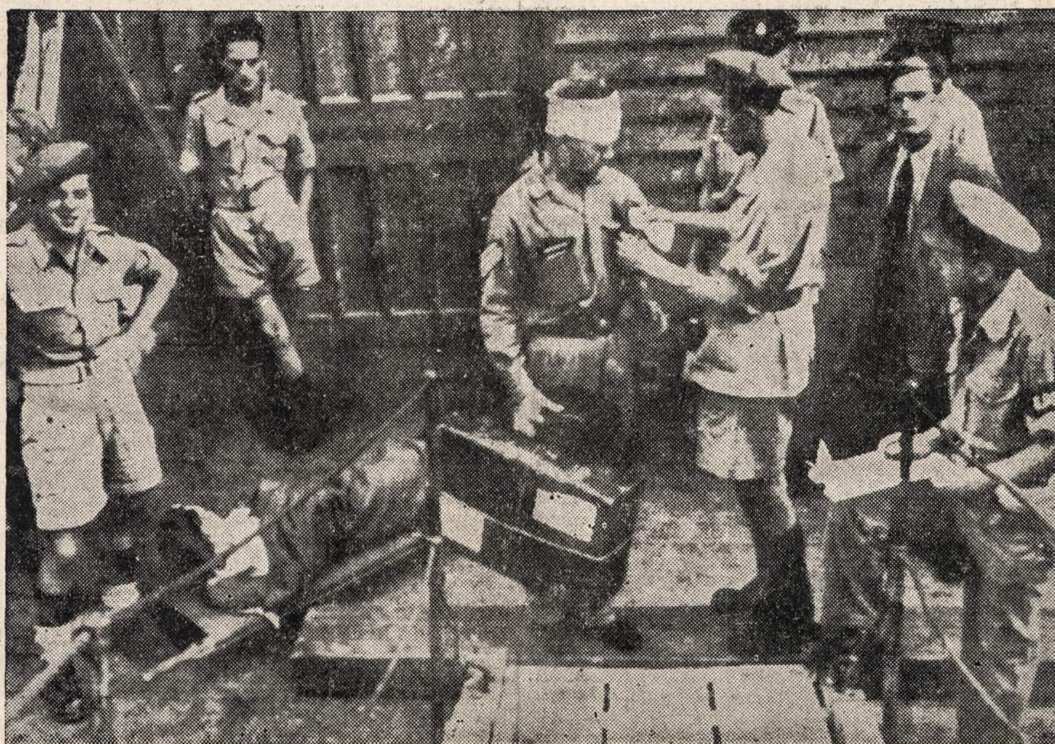
Britų kariai, kurie buvo sužeisti Haifa mieste, einant mūšiams tarp arabų ir žydų. Sužeistieji yra gabenami iš uosto į ligoninės laivą "El Din".