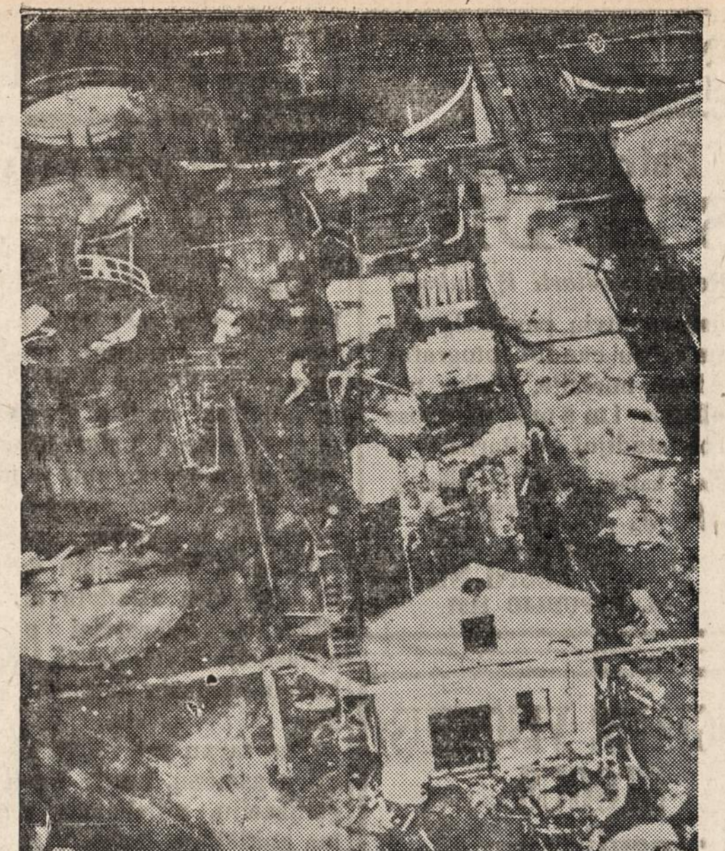
KEARNEY, N. J. — Koppers Coke kompanijos pastatas po eksplozijos. Nuo eksplozijos žuvo devyni asmenys, o vienas buvo mirtinai sužeistas.

"Naujienos" — yra Jūsų Geriausias Draugas — Užsirašykite Jas.