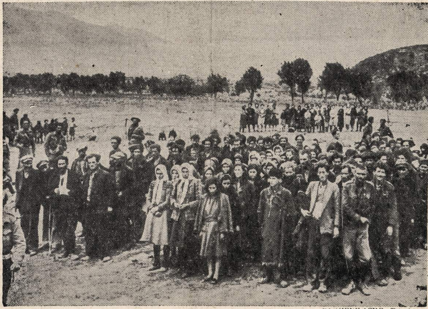
GRAVIA, GRAIKIJA. — Kariai rikiuoja 141 partizaną, kurie buvo apsupti ir sumiti. Tarp partizanų matosi ne tik suaugę vyrai ir moterys, bet ir vaikai.