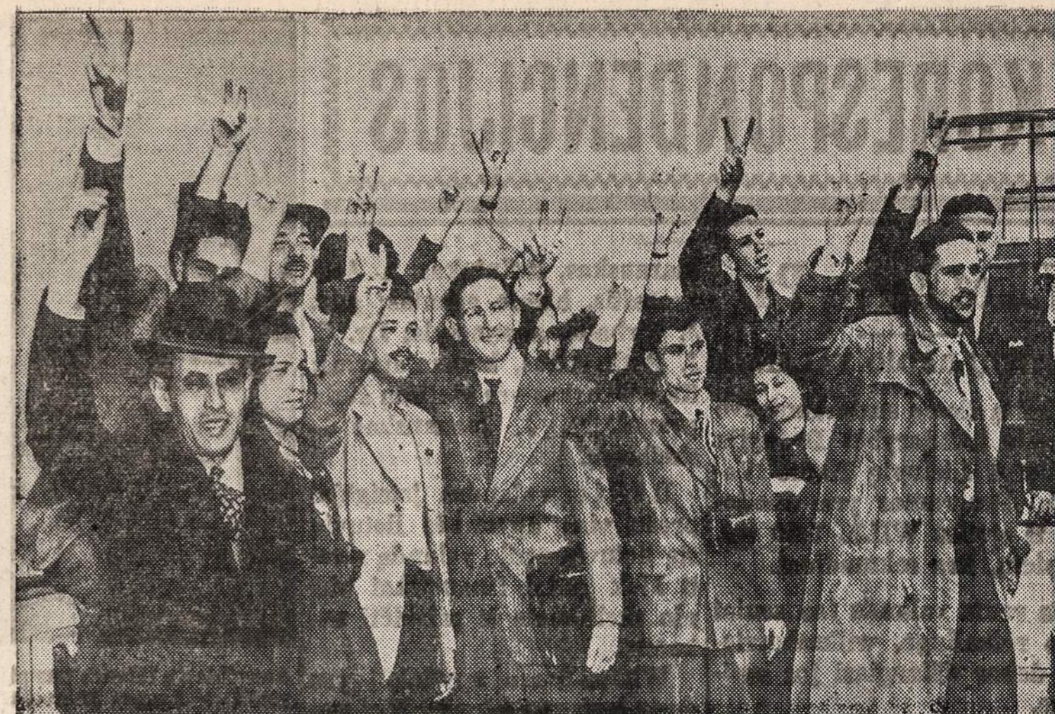
Studentai ant "Marine Carp" laivo dėnio. Iš New Yorko jie išplaukė į Palestina. Tarp jų buvo 41 amerikietis. Beirute laivas buvo sulaukytas ir Lebano pareigūnai privertė 69 zionistus nūlpti nuo laivo.

Bomba buvo numesta gegužės 13 dieną, bet iki šio metodo nepavyko tiksliai nustatyti žuvusiųjų vardų.