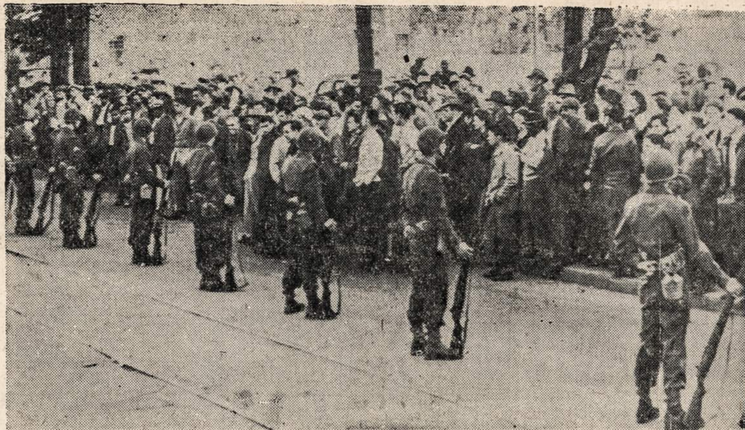
WATERLOO, IA. — Tvarkai palaikyti prie Rath gyvulių skerdyklos buvo pašaukta valstijos kariuomenė. Sakytos skerdyklos darbininkai išėjo į streiką.