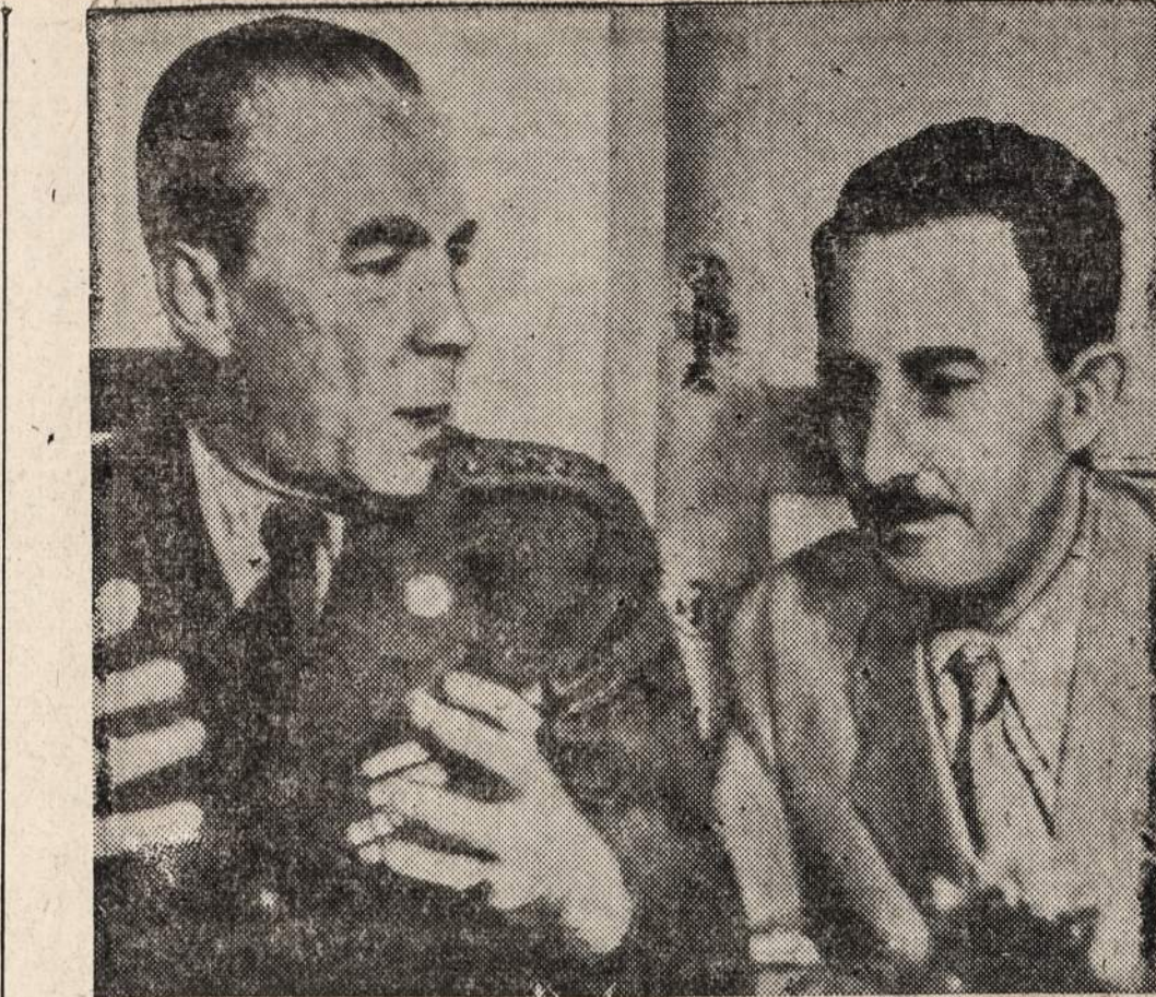
Grafas Folke Bernadote (po kairi) ir Moshe Shertok keturių savateių stulomas paliaubų sąlygas. Jūdvieji susitikimas įvyko Haifa mieste.

"Nuostabią tautų globėja ir gelbėja Sovietų Sąjunga yra apsupta kraugerinių kapitalistinių valstybių, kuriose darbo žmonės yra mušami su bota-