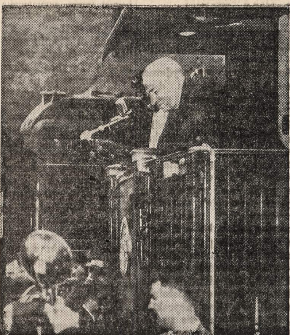
Pittsburgho stotyje prezidentas Trumanas tariasi su demokratų partijos vadais ir vietos pareigūnais.

Laiško autorius, toliau, sako, kad suiminėjami ir žudomi buvo taip pat ir šiaip inteligentai — universiteto profesorai ir k. Kai kurie seni mokslininkai šioje teroro atmosferoje buvo taip įgašdinti ir prislėgti, kad