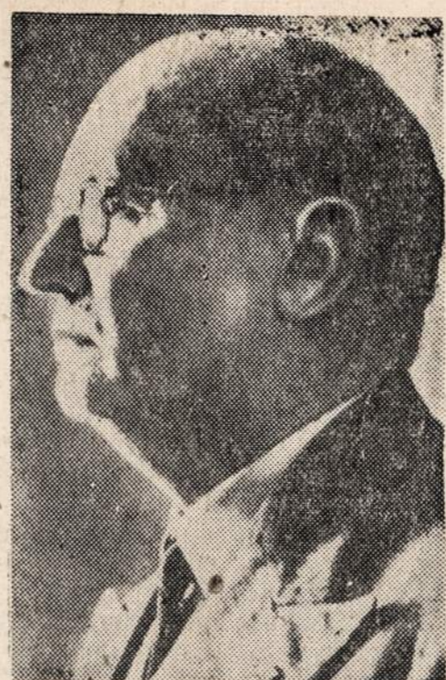
Dr. D. F. Malan, kuris sudarė Pietų Afrikos valdžią, Rinkimuose jo vadovaujama partija laimėjo. Pasakojė Jan Christian Smuts vadovaujama valdžia priversta atsistatydinti.