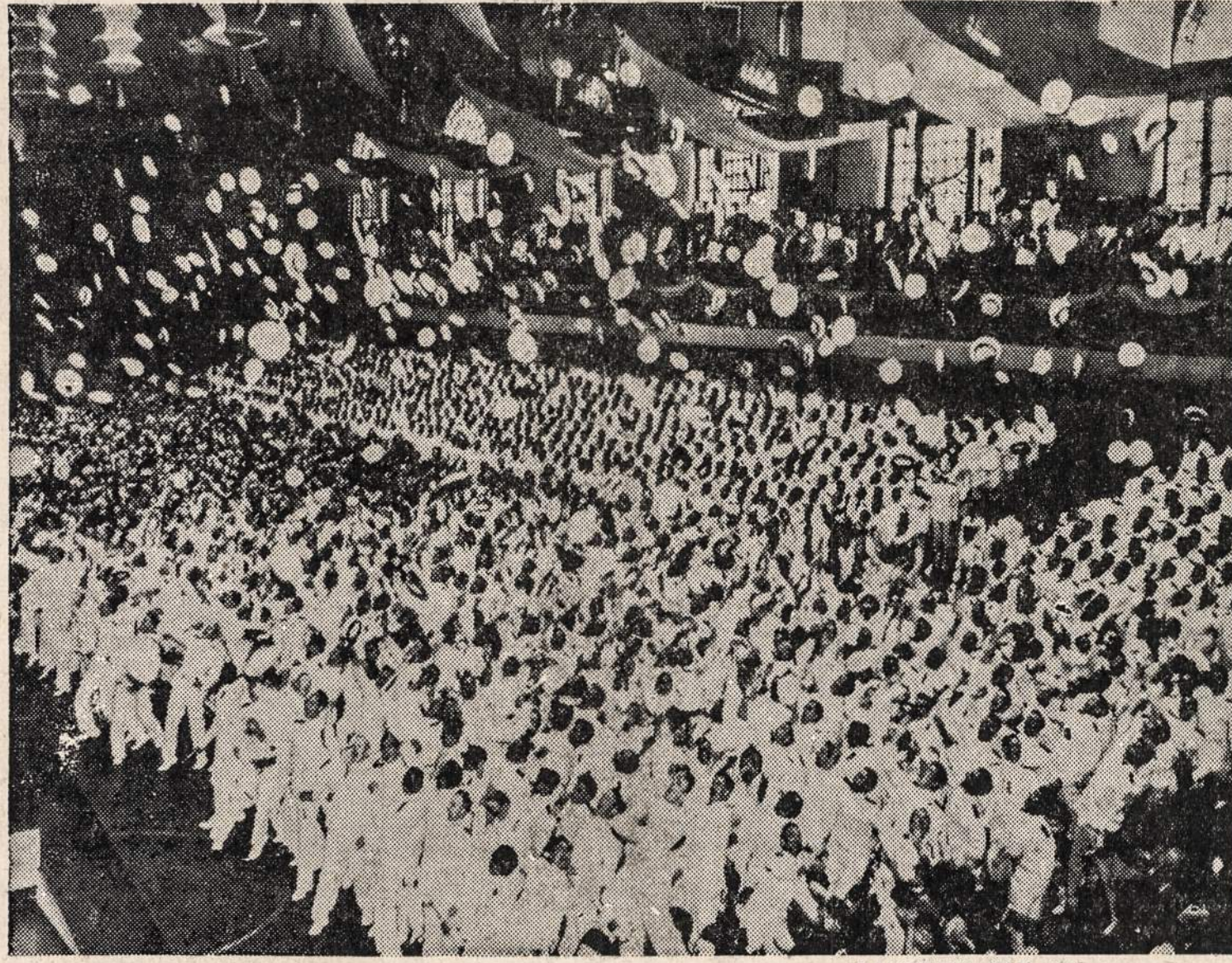
Laivyno mokyklos mokiniai, gavę savo diplomus, mėto kepurės į viršų. Panašus būdas džiaugsmui reikšti laivyno mokykloje jau virto tradicija.