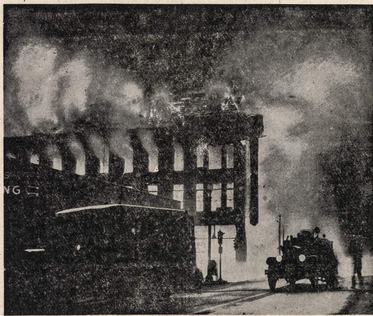
Liepsnos veržiasi iš Duluth, Minnesota, namų. Gaisro metu sudegė daug prekybos centrų, nuostoliai siekia milijoną dolerių.

vokiečiams lieps jį pakeisti. Karo vadai kontroliuos vokiečių finansų ir užsienio reikalus.