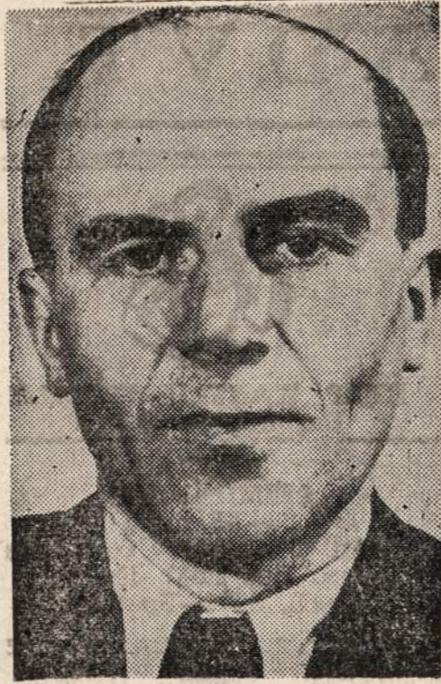
Austrijos jėgos paskirstymo ministras Alfred Misch, prieš kurį sovietų pareigūnai Vienoje rengiasi imti "atitinkamų priemonių", nes jis prancūzų zonoje pareiškė, kad "Rytų bloko valstybės turi daryti tai, ką įsako Maskva ir kas prisideda prie Rusijos rekonstrukcijos bei apsiginklavimo".

Turim žinoti ir tai, kad mūsų tauta, proporcingai bendram jos gyventojų skaičiui, bus viena iš daugiausiai nukentėjusių nuo raudonųjų ir rudųjų budielių. Mes klausiam: kodėl lietuviai buvo ir šiandien tebėra taip masiškai kankinami ir žudomi? Atsakymas yra vie-