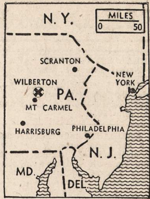
Vieta netoli Mt. Carmel, kur nukrito didžiulis lėktuvas, skridęs iš San Diego į New Yorką. Žuvo 43 asmenys.

Šis jaunuolis yra labai kuklus, mažai reklamuojamas, nors turi jau daug gražių darbų nuveikęs. Ar buvo pastebėtas jo birželio mėn. pasirodymas? Beveik ne. Vien šykštus žodelis spaudoje... Ne iš gero dabartinė jaunuolio pamotė yra gyvai susirūpinusi. Tartum