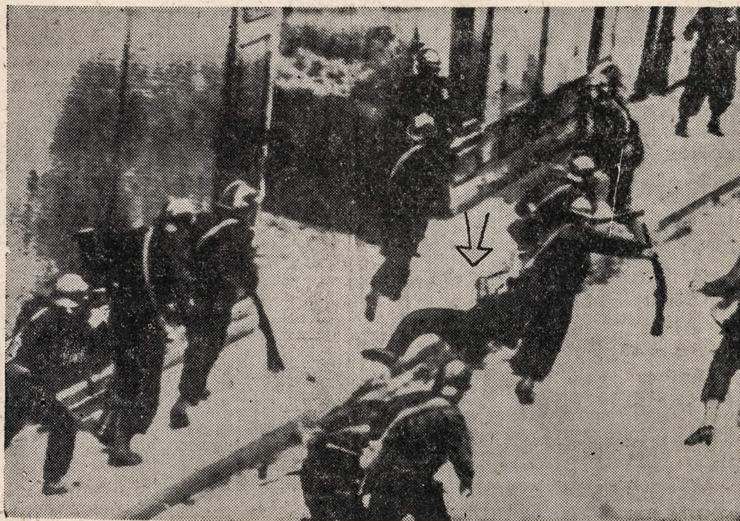
CLERMONT-Ferrande, Prancūzijoje, tarp streikininkų ir specialios policijos įvyko susirėmimas.

raelis, ir 2. kad netrukdytų žydų imigracijos į Palestiną.