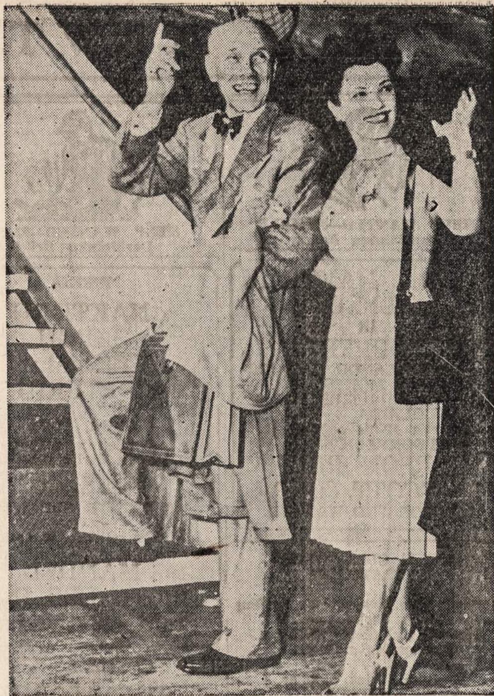
Earl Carroll, išgarsėjęs teatrininkas, ir jo viena teatro žvaiz-ždė, Beryl Wallace, žuvo aviacijos nelaimėje prie Mt. Carmel, Pa.

Tamsta, tur būt, iš laikraščių ir iš paskaitų žinote, koks sun- kus ir slėgiantis yra tremtinio gyvenimas, todėl Tamstos ir nevarginsiu jo aprašymu. Gy- vename kas dieną viltimi iš- trukti iš to savo rūšies pragar- —kalėjimo. O dabar gavus iš Jūsų affidavitus, atrodo, kad tas čirkėčiais klotas tremties gyvenimo kelias greitai užsi-