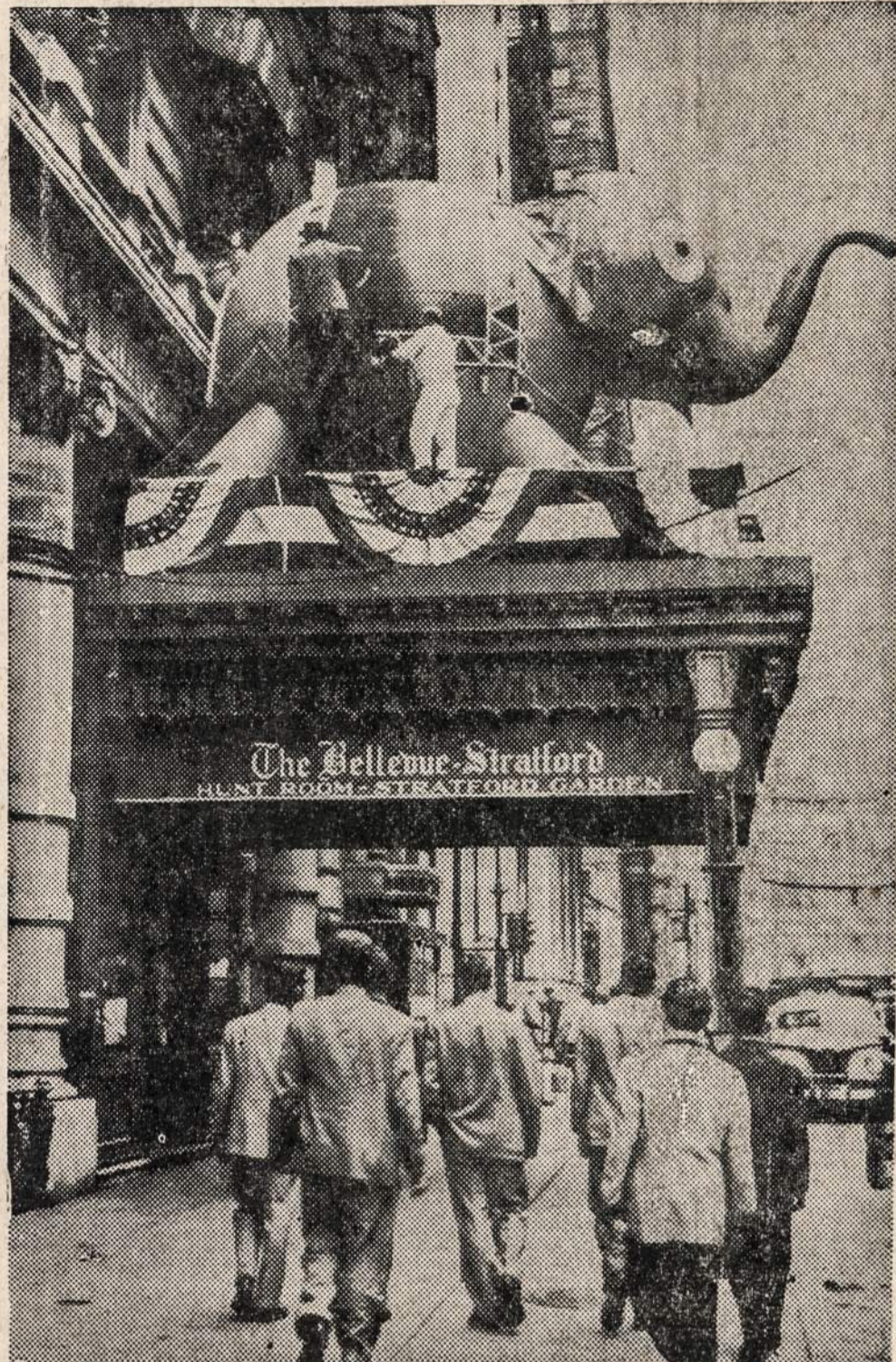
Darbininkai pastatė didžiulį dramblių—republikonų partijos simbolį. Šiandien prasideda republikonų konvencija Philadelphijoje, partijos rinkti atstovai į šį miestą jau pradėjo rinktis praeitą savaitę.