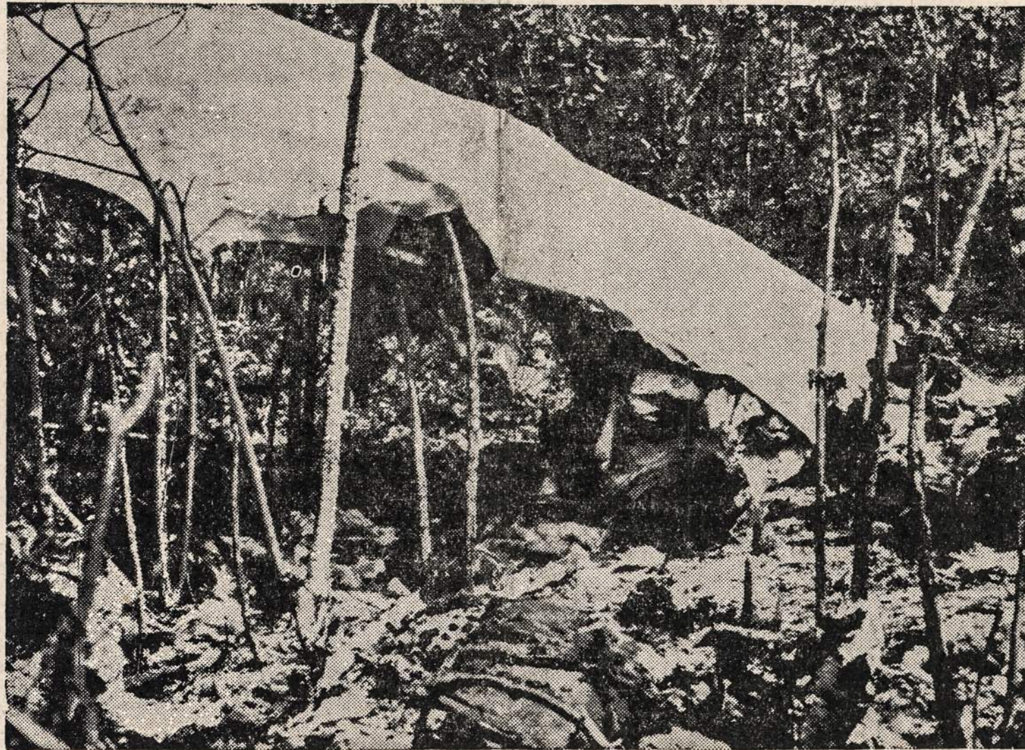
Likučiai lėktuvo, kuris nukrito ir susidaužė netoli Mt. Carmel, Pa. Žuvo 43 žmonės.