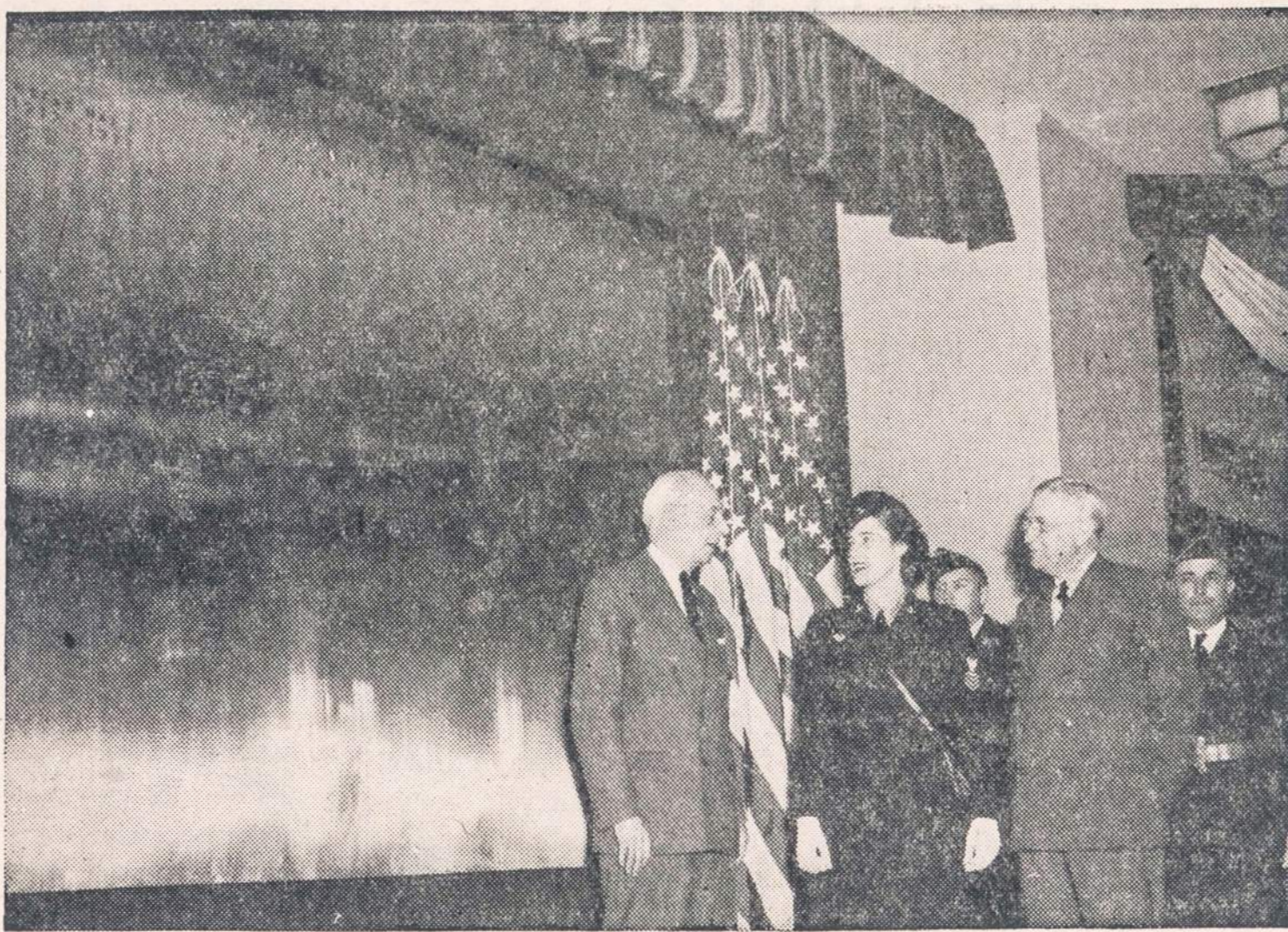
Šiomis dienomis Commonwealth Edison Company sukūrė paminklą — iš nerudijančio plieno padarė sąrašą savo samdinių, tarnavusių J. Valstybių ginkluotose jėgose pirmojo ir antrojo pasaulinio karo metais.