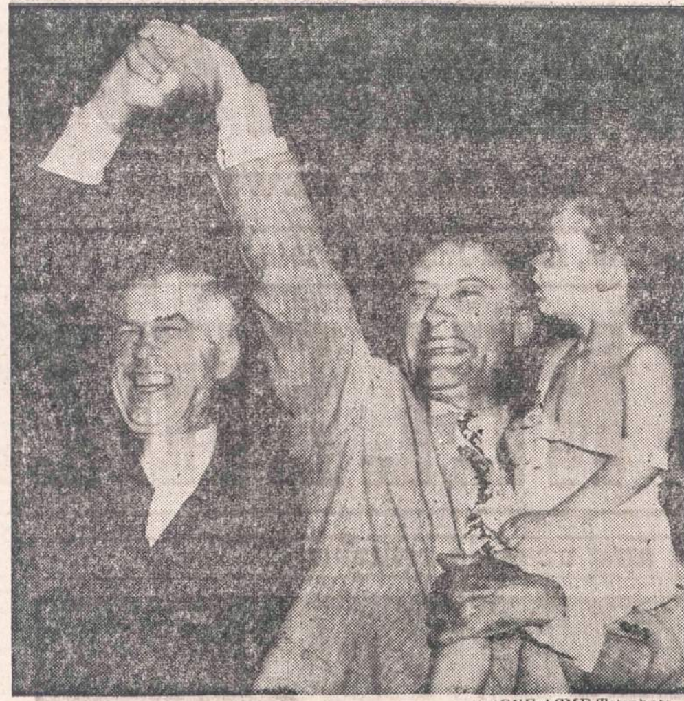
Hery A. Wallace (kairė) ir sen. Glen Taylor, progresyvių partijos kandidatai į prezidentus ir viceprezidentus Taylor laiko rankose savo dviejų metų suau.

"NAUJIENAS" SKAITO VISŲ SROVŲ ŽMONES: DARBININKAI, BIZNIERIAI, PROFESIONALAI, DVASININKAI, VALSTYBININKAI, MOKSLININKAI. JIE ŽINO, KAD NAUJIENAS PADUODA TEISINGIAUSIAS ZINIAS IR GERIAUSIAS RASTUS.