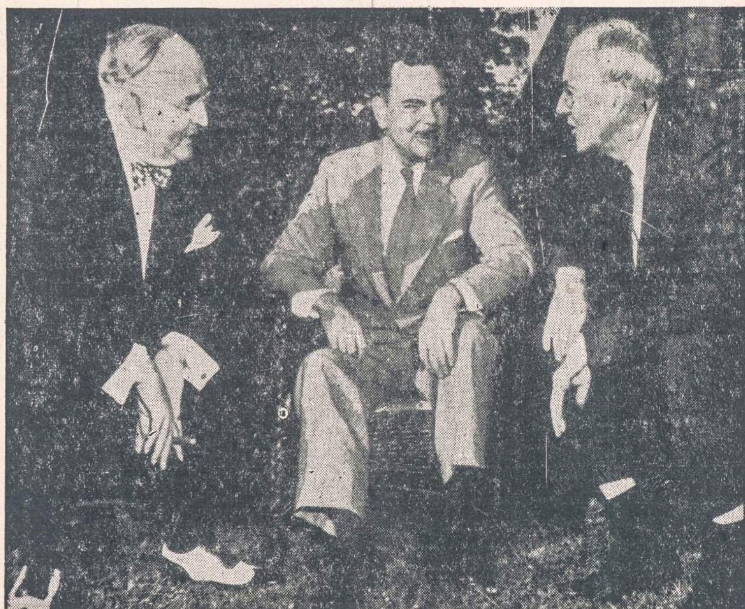
Gubernatorius Thomas E. Dewey tariai su senatoriu Arthur Vandenberg ir advokatu John Foster Dulles. Republikonų kandidatas į prezidentus pakvietė partijos vadus į savo farmą Pawlinge, N. Y., kad galėtų pasitarti dėl Berlyno, Vokietijos ir kitų užsienio reikalų.