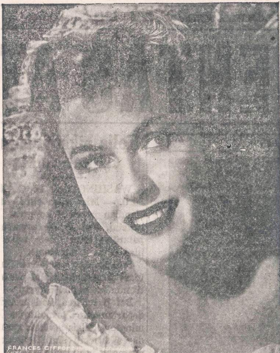
SHE STARTED OUT to be a lawyer but was sidetracked at the M-G-M studio. She played in a number of Tarzan pictures, then came "Cry Havoc," "Marriage Is a Private Affair," "Thrill of a Romance," "The Arnelo Affair," and will be seen next in "Luxury Liner." Is She- 1. Frances Gifford 2. Dale Evans 3. Karin Booth 4. Phyllis Thaxter She is (Frances Gifford) She is is

"A, matai, jos užrūstino saule". Bobutė ravėdama ėmė pasakoti. Seniai labai seniai ir varlės buvo šiltakraujai sutvėrimai, kaip ir kiti gyvuliai. Gyveno jos, kaip ir dabar, pelkėse, upėse, ir pievose; tik vandenį labiau mėgo už sausumą, kaip ir dabar. Toks tik skirtumas, kad saulės nebijojo ir dažnai atsaulėje kaitindavosi, kaip kad judvi darote; besikaitindamos ir uždainuotė mėgdavo. Kartą viena vartė, gerai saulėje pasikaitinusi, gerokai prakalė ir nušokusi į paupį dairėsi, ką čia vakarienei pasigauti. Neilgai trukus, pamatė mėlyną sparną laumės žirgelį betupintą ant vandeninės lelijos žiedo. Žirgelis buvo nuostabiai gražus: jo plonučiai kaip šydas sparnai atrodė išausti iš laumės juostos, mirgėdami spindėdami prieš saulę jie švytavo visomis vaivorykštės spalvomis. Žirgelis pamažu suposi ant žiedo, įsižiūrėjęs į savo atvaizdą vandeny; besigrožėdamas juo pamiršęs visą pasaulį, nė nepamatė, kaip varlė pačiupo jį už sparno.