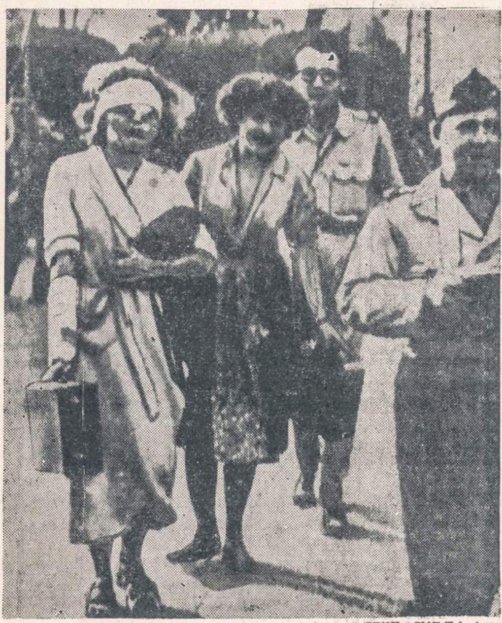
LUDWIGSHAFEN, Vokietija. — Iš I. G. Farben įmonės, kur įvyko didelė eksplozija, yra išvedami darbininkai, kurie išliko gyvi.