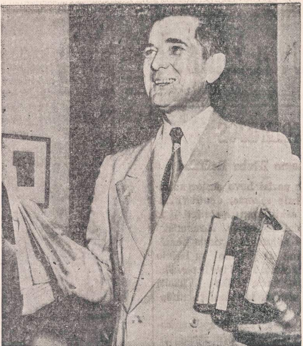
Senator John Stennis (demokratas iš Miss.) pasiryžęs kaip galima ilgiau tęsti debatus, kad nebūtų priimtas "anti-poll tax" bilius.

Wm. Z. Foster ir jo draugai turės progą apsiginti, jeigu jie nekalti.