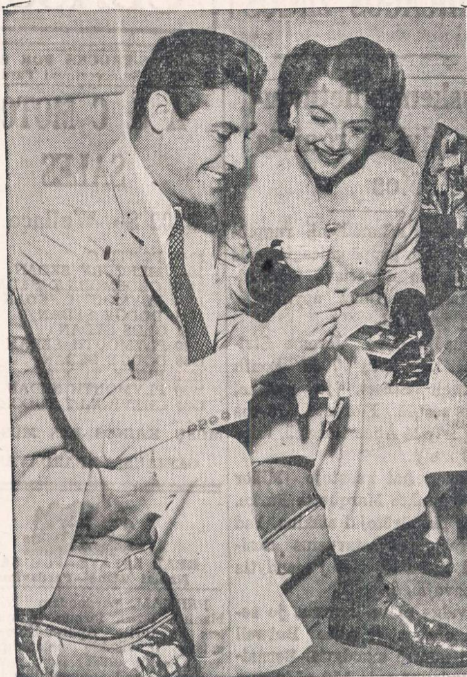
ANNE BAXTER and John Hodiak felt right at home while they were working in M-G-M's "Homecoming." And why not? They are Mr. and Mrs. Hodiak in private life. In the new film, however, Anne plays Clark Gable's wife and Hodiak is his best friend. Lana Turner is co-starred.