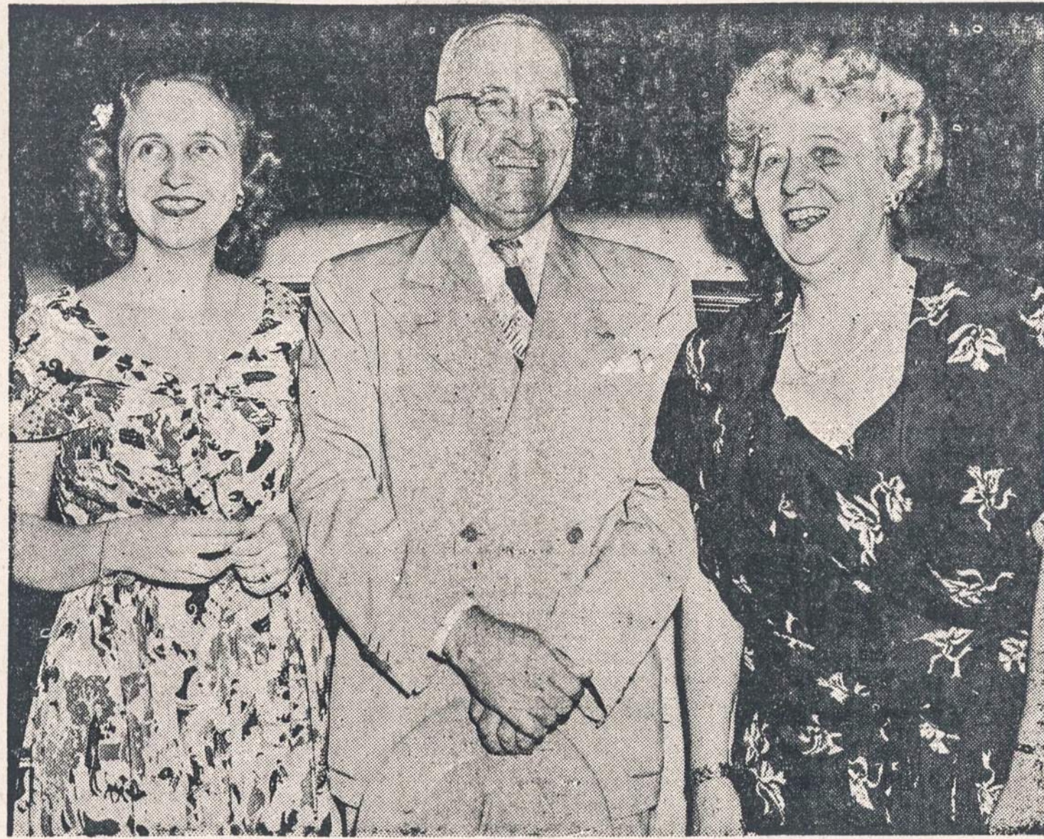
KANSAS CITY, KANSAS. — Prezidentas Trumanas susitinka su savo žmona ir dukteria aerodrome, grįžęs iš New Yorko. Nuo to laiko, kai demokratų konvencija pasibaigė, p-ia Truman su dukteria apsigyveno vadinamuose Vasaros Baltuosiuose Rūmuose, Independence, Mo.