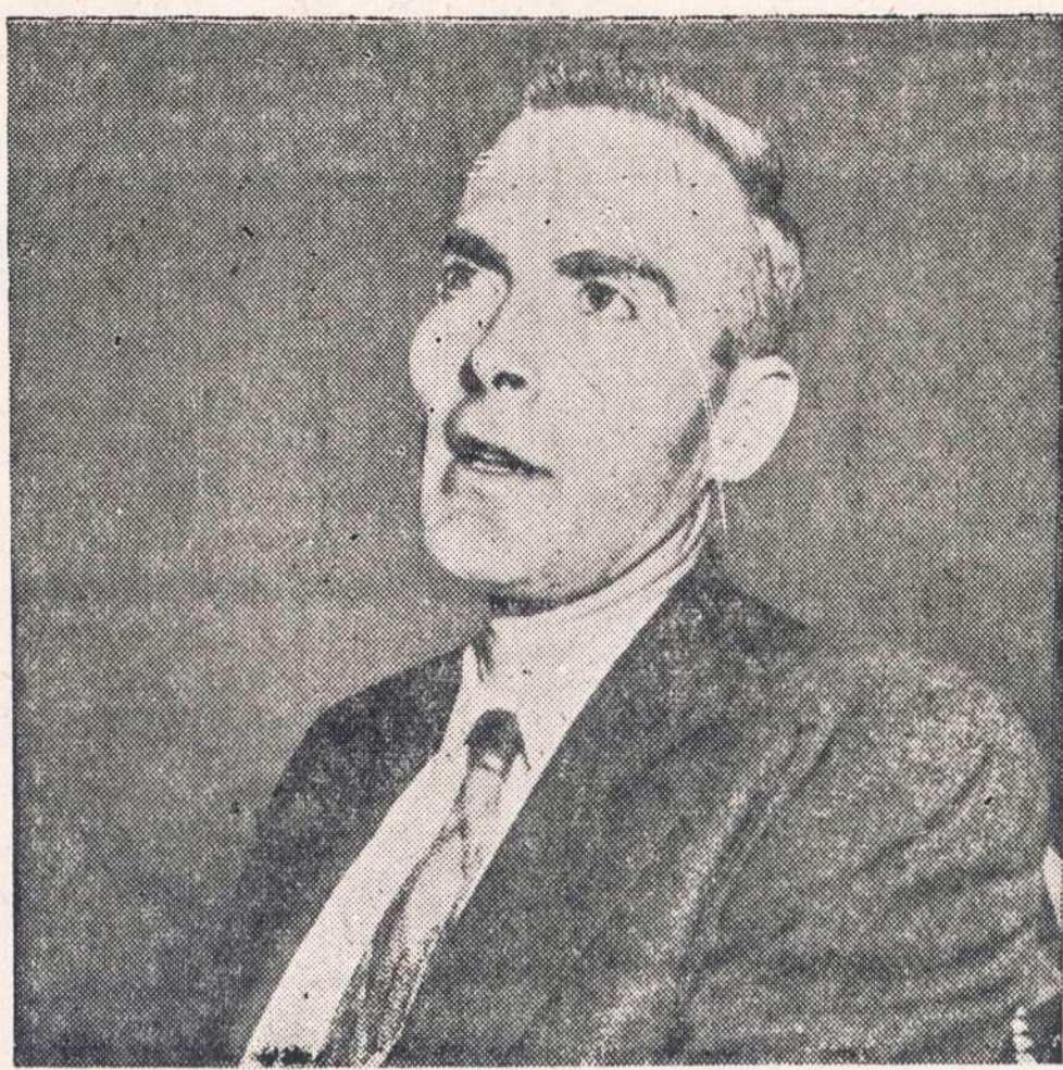
William W. Remington, Prekybos departamento ekonomistas, Senato investigacijos komiteto pareiškė, kad jis nėra komunistas. Elizabeth Bentley, buvusi sovietų šnipė, teigia, jog iš Remingtono ji gaudavusi slapčią informaciją.

Stalino konstitucijoje, visuose plakatuose, skelbimuose, susirinkimuose, laikraščiuose stambiom raidėm pabrėžiama, kad kiekvienas tarybinis pilietis nelaimėjęs turi nemokamą teisę į gydymą, senatvę — į ap-