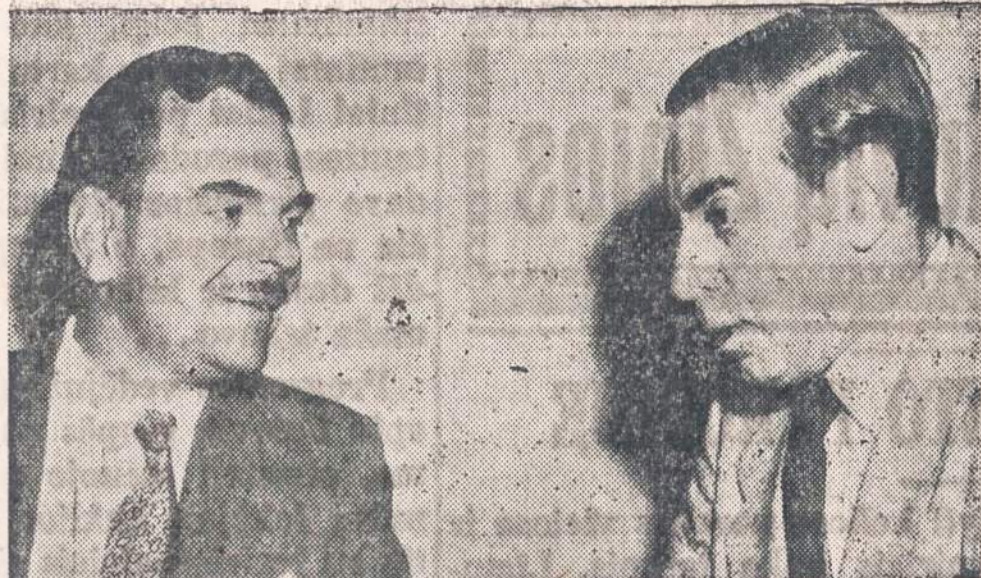
ALBANY, N. Y. — Pas Thomas E. Dewey, republikonų kandidatą į prezidentus, svečiuojasi aktorius Eddie Cantor.

vienu tiktaai savo partijos atstovų, kad nebūtų priekaištų, jogei jisai eina su "dešiniaisiais." Toks kabinetas ir buvo sudarytas. Jį remia valstiečių partija, ir jisai turi aiškią daugumą seime.