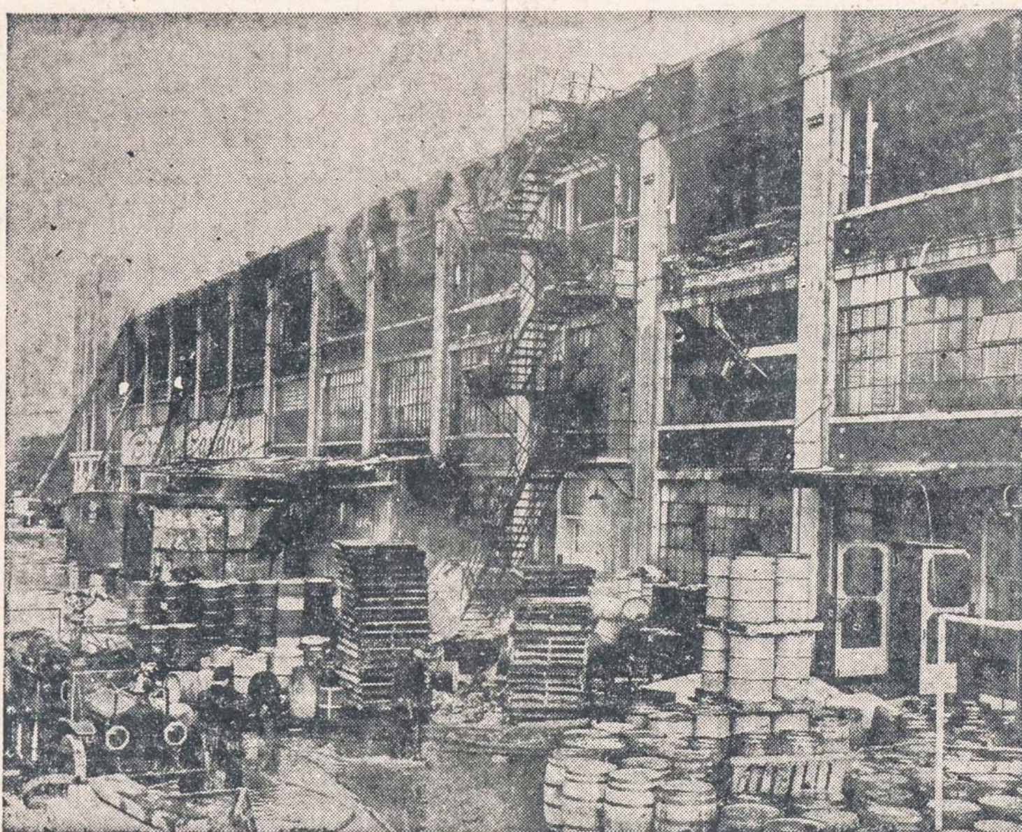
Ekspliozija Brach saldainių dirbtuvėje, kuri randasi Chicagoje. Dėl eksplozijos žuvo 3 darbininkai, o 18 buvo sužeisti,—iš jų kai kurie labai sunkiai.