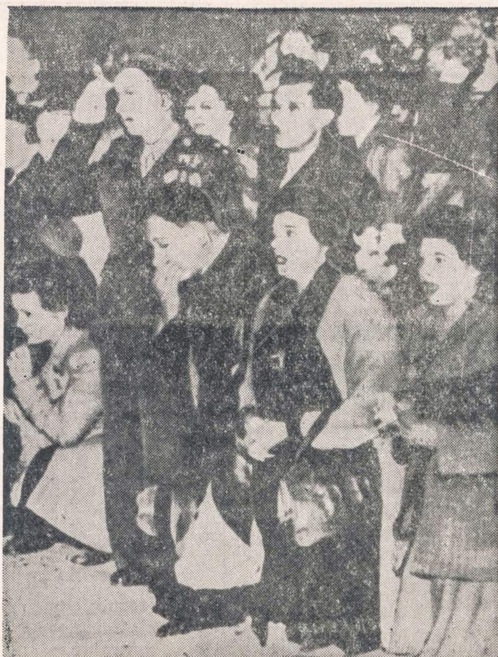
Buvusio Čekoslovakijos prezidento Eduard Benes laidotuvas virto savo rūšies demonstracija prieš komunistų valdžią. Policija areštavo 200 žmonių.