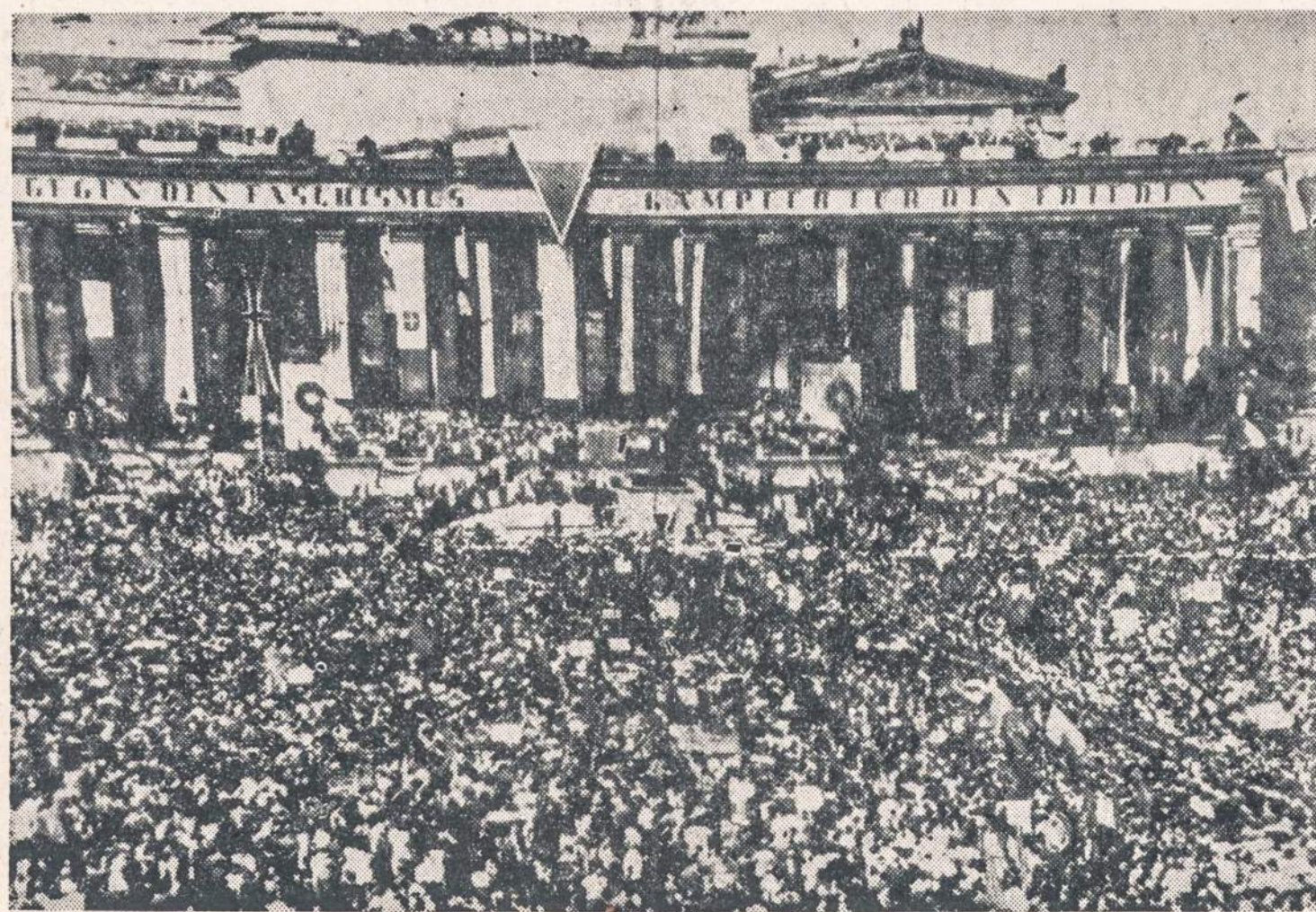
Maskva. Komunistų demonstracija Berlyne, kuri įvyko pereiną sėkmadienį sovietų valdomoje miesto dalyje. Demonstracijoje dalyvavo apie 50.000 žmonių. Ji buvo bent tris kartus mažesnė, negu pereiną savaitę surengta anti-komunistų demonstracija.