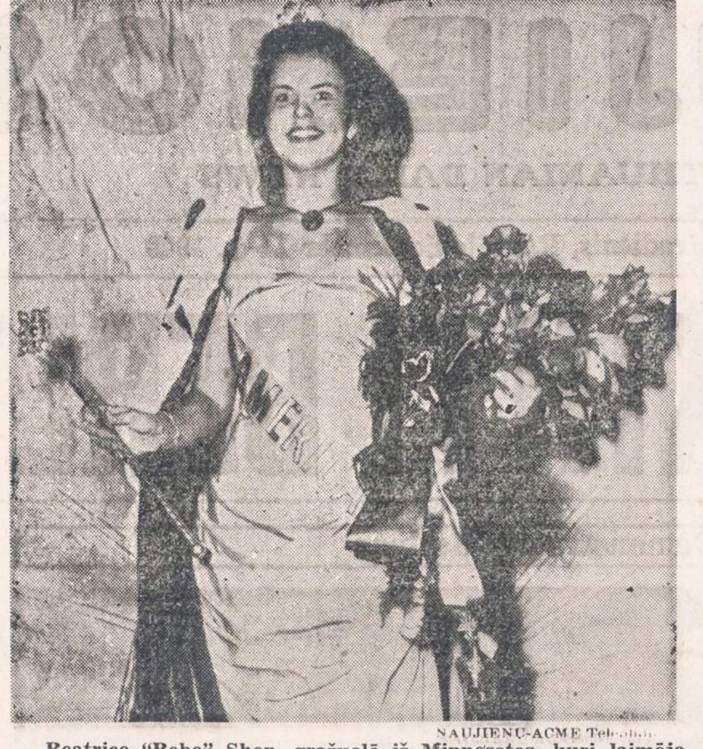
Beatrice "Bebe" Shop, gražuolė iš Minnesotos, kuri laimėjo "Miss America" titulą mieste Atlantic City, N. J.