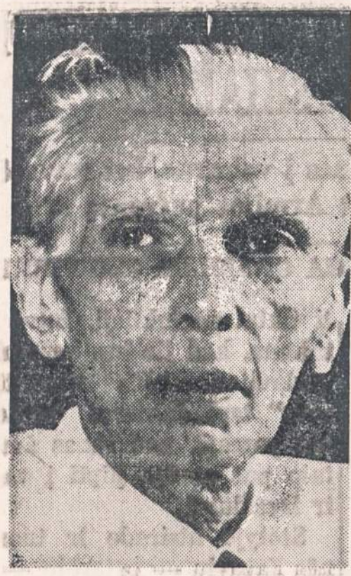
MOHAMMED ALI JINNAH, 71 metų amžiaus, Pakistano dominijos (Indijoje) generalinis gubernatorius, kuris po ilgos ligos mirė Karachi mieste. Jis buvo Indijos musulmonų vadas.

Tai yra gynai tautinis pasipriešinimas. Kai kuriuose šveicarų ir net amerikiečių laikraščiuose pranešimai, kad Lietuvos partizanai savo ideologu laiko Rozenbergą, kad oficialioji jų kalba — vokiečių, kad vokiečiai naciai jiems vadovauja, kad net kažkieno svetimi lėktuvai iš jų ginklus mėtė, — visos tos žinios yra sovietinių šaltinių padaras. Pasipriešinimas sovietams varomas lietuvišku krautu ir gyvybėm. Lietuvos partizanai galėtų atvirai ir nuosirdžiai pasakyti visiem Vakaram: Su bolševizmo viską naikinančia banga, srūvančia į Vakarus,